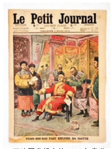
法國畫報中的1912年袁世凱剪辮子