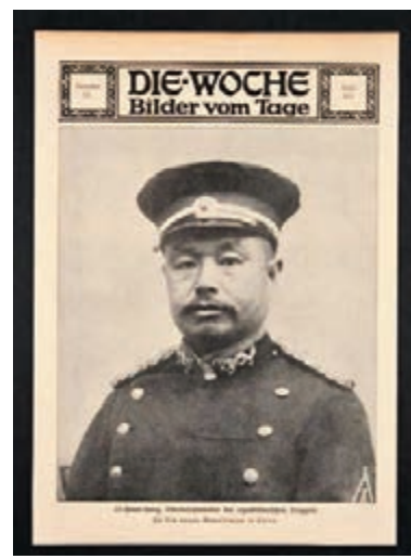
德國報紙中的黎元洪