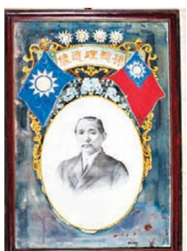
孫中山逝世之後的遺像