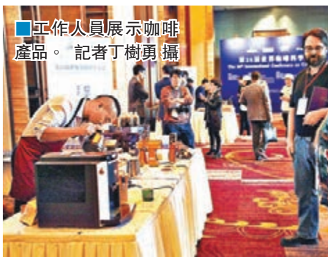
■工作人員展示咖啡產品。

香港文匯報訊(記者 丁樹勇 昆明報道)第26屆世界咖啡科學大會13日在雲南昆明開幕，會期將持續至19日，並在雲南芒市和重慶設分會場。