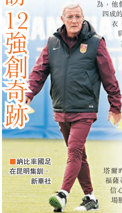
納比率國足在昆明集訓。新華社