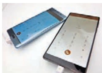
小米MIX(右)採用全陶瓷機身，生產難度甚高。

早前在北京舉行的發佈會上，如果說如期公佈的雙曲面商務旗艦小米Note 2是眾望所歸的話，全面屏概念手機小米MIX無疑是超出預料的驚喜。當視野無比開闊的全面屏出現在發佈會的PPT上時，瞬間帶來彷彿是握住全世界的視覺衝擊。