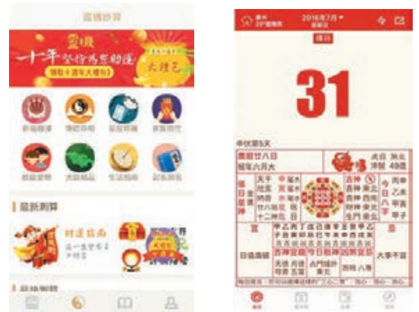
「靈機妙算」集中西命理學說之大成。

另外，同公司也推出了另一個App「順曆」，猶如通勝般可簡單查出每天是否好日，使人更容易去趨吉避凶。