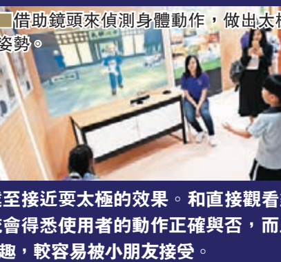
借助鏡頭來偵測身體動作，做出太極姿勢。

浸大開發的太極遊戲，借助Kinect配件來偵測使用者的手部動作，只要跟隨畫面中的太極老師擺動雙手，就能達到接近太極的效果。和直接觀看錄影片段不同，系統會得悉使用者的動作正確與否，而且該太極老師畫風有趣，較容易被小朋友接受。