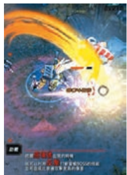
《機甲核心》操作並不複雜，基本上只需一隻手指控制。