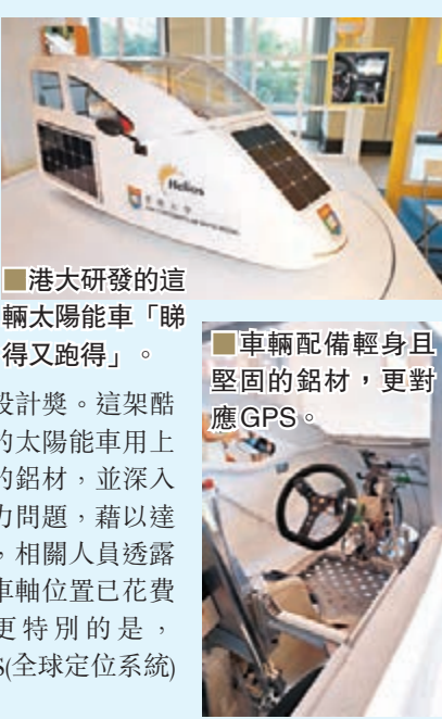
港大研發的這輛太陽能車「聯得又跑得」。車輛配備輕身且堅固的鋁材，更對應GPS。

各間大專院校今年初參加了由機電工程署主辦的「新能源、新時代」太陽能車設計比賽，最終由香港大學三個工程系教授及研究人員所製作的Helios(太陽神)奪得總冠軍和創新設計獎。這架酷似子彈火車車頭的太陽能車用上雙層巴士所使用的鋁材，並深入研究多方面的阻力問題，藉以達到最節能的效率，相關人員透露單是精準地調校車軸位置已花費了不少工夫。更特別的是，Helios可安裝GPS(全球定位系統)來輔助行駛。