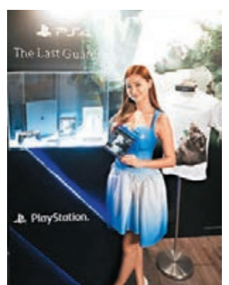
《The Last Guardian》珍藏版附送多款精品。

日前SIEHK舉行兩個新作預覽活動，先有本月29日推出的JRPG超大作《FF15》，接着是開發周期橫跨兩代主機的《The Last Guardian》。作為「上田文人三部曲最終章」，《The Last Guardian》同樣是少說話(甚至零對白)、多解謎，在猶如宮崎駿電影世界的古文明遺蹟場景裡，主角要借助巨鷲Trico幫手解破機關和對付敵人。於可試玩的兩個demo中，最需要掌握是跟Trico的溝通技巧，為求真玩家並非每次都能得心應手，有時要叫好幾次牠才有反應，似是和寵物交流那樣。定於下月6日發售的本作，除普通版($398)、鐵盒版($468)和附送模型和設定集等的珍藏版($858)外，還有首批贈送限量T恤的主機同捆版($2,880)。另外，《FF15》的「月餅盒」特別同捆主機亦會有行版，連同遊戲光碟索價$3,180。