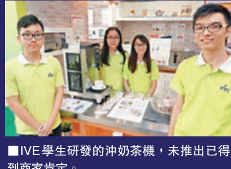
IVE學生研發的沖奶茶機，未推出已得到商家肯定。

最後是由IVE學生研發的自動沖奶茶機，據知現已獲連鎖餐廳青睞，有意將它引入到店內使用。這部機可檢查所使用熱茶的濃度，因應用家輸入的較濃、正常和較淡需要，從而藉超聲波來判斷到底應把水加熱至多少度等。在目前爆出的智能咖啡機初創風波下，希望這部奶茶機能對香港科研帶來一點希望。