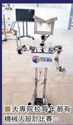
大專院校每年都有機械人設計比賽。

同樣是城大的出品，畫面顯示香港街道，玩家扮演一名要逃離食環署追捕的流動小販。只要在跑步機上奔跑，便能把追捕者甩開，當然過程絕對是很辛苦，學生可因而得知小販的情況，提高社會對他們的關注。