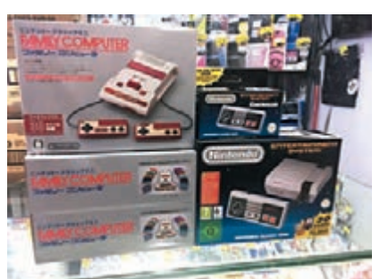
懷舊紅白機(左)與其「胞弟」懷舊灰機經已推出。

上周四(10日)在日本有兩部「新機」面世，分別是可輸出4K畫面的PS4 Pro和「30合1」懷舊紅白機，前者在香港甫推出即被搶光，但在日本情況則相反，這部懷舊紅白機竟賣斷市！因它價錢平兼能以HDMI輸出，讓玩家可在較佳畫面下重溫約30年前的舊夢。懷舊紅白機收錄有《寶寶兄弟》、《FF3》、《惡魔城》和《熱血行進曲》等在本港深受歡迎的30款作品，玩家可以隨時儲存進度，無需每次都從頭來過，對現今都市人而言確是很體貼；其唯一缺點是手掣的線較短且很細，售價大約$769。至於外觀為紅白機海外版本「灰機」的同類產品，連鎖店電氣良品最近亦有入貨，除外觀外其餘遊戲亦有少許分別。「灰機」歐洲版售價約為$798。