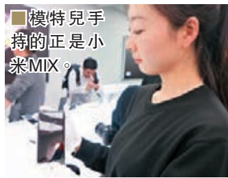
機特兒手持的正是小米MIX。

陶瓷工藝是品牌從小米5開始探索的高階科技，由於它的複雜和超高性能，能實現的少之又少，之前僅在小米5尊享版、蘋果全陶瓷智能手錶等少數的極致產品中實現。今次小米MIX不僅繼續採用陶瓷，而且使用令人瞠目結舌的全陶瓷機身，中框和後蓋的陶瓷銜接處從中國傳統結構工藝吸取靈感，實現了「榫卯」卡扣式連接工藝，讓本來最難結合的陶瓷完美銜接，成為全球首款全陶瓷機身的智能手機。