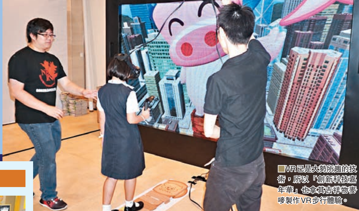
VR已是大眾所趨的技術，所以「創新科技嘉年華」也拿其吉祥物麥嘜製作VR步行體驗。

從上月中起，香港展開了為期半月之「創新科技月2016」，以多項活動向社會各階層推廣創新科技。其中重點之一的「創新科技嘉年華」日前已於香港科學園圓滿結束，透過各大專院校的科研產品、工作坊以及專家講座，向市民和中、小學生介紹現時的科技潮流，當中不乏在現實生活中大有用途的創意想法。別以為一定要工業界才有創意，其實學生哥的奇想天開也令人讚嘆。 文、圖：電能小子