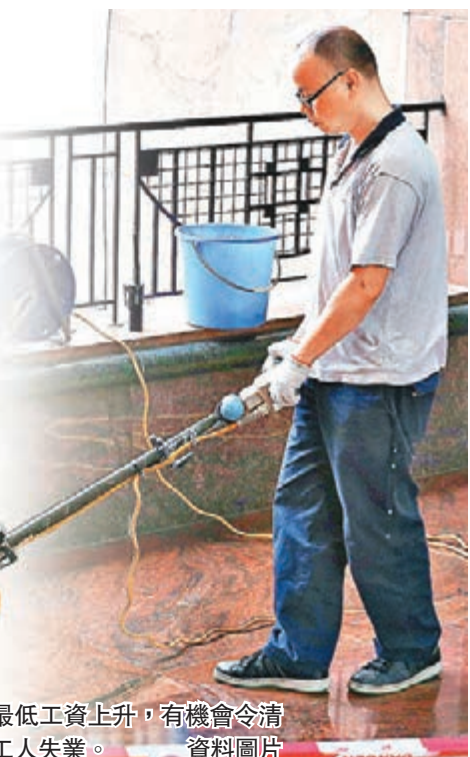
■最低工資上升，有機會令清潔工人失業。 資料圖片

第三，綜合社會保障援助計劃(下稱「綜援」)下的「低收入」個案近年持續下降，由2011年3月的14,088宗，大幅削減至2015年3月的7,302宗，累積減幅高達48%。當局向「低收入」個案提供的相關綜援款額，亦由2010至2011年度的10.69億元，下跌至2013至2014年度的7.42億元，累計跌幅為31%。