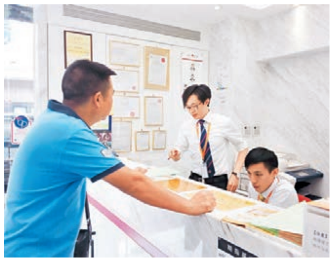
■李先生赴上水耀才證券開設港股賬戶，該行表示近期內地客前來開戶增長了一兩倍

楊先生本人也看好這些價值被低估，又有想像空間的個股。他透露，已斥資數百萬元買入了五洲國際(1369)，該股是地產股，業績不錯，其市值30億至40億港元。另外，航天系也有多隻個股市值在30億至40億港元，業績都不錯，因此他買入一兩隻個股，每隻股票的投資金額都逾200萬港元。