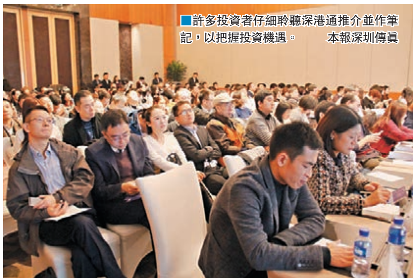
■許多投資者仔細聆聽深港通推介並作筆記，以把握投資機遇。