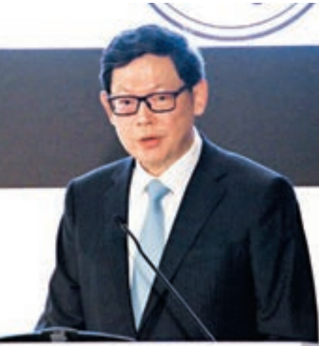
金管局總裁陳德霖。