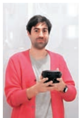
深企12月將推出由法國設計師設計的VR相機。

美國當地時間11月10日，全球消費類電子展CES在紐約正式揭曉2017年度「最佳創新獎」，由深圳看到科技研發的3D全景相機Obsidian（黑曜石）摘得數碼影像類的「最佳創新獎」，這是中國品牌首次獲獎。記者在現場看到，該款相機有六個攝像頭，可以360度拍攝，從而形成3D效果和情景。據悉，該相機