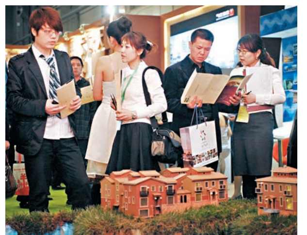
■新增貸款中,以住房按揭貸款為主的住戶部門中長期貸款佔比高達75%。資料圖片

貸款結構上,10月住戶部門貸款增加4,331億元,其中短期貸款減少561億元,中長期貸款增加4,891億元,佔到當月新增信貸規模75%,顯示居民消費意慾降,按揭貸款則繼續高企。企業信貸需求繼續疲弱。當月非金融企業及機關團體貸款增加1,684億元,其中短期貸款減少438億元,中長期貸款增加728億元,票據融資增加1,097億元。另外,10月包含信託貸款等在內的社會融資規模增量僅為8,963億元,比去年同期多3,370億元,但較9月1.72萬億元的規模縮水明顯。