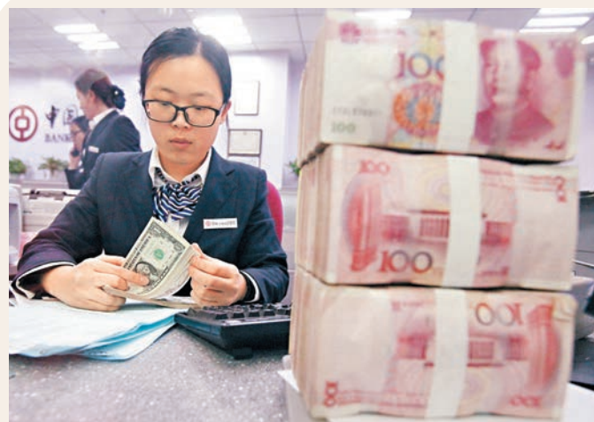
■昨日人民幣兌美元中間價下調230點至6.8115,為2010年9月2日以來首次跌破6.80關口。資料圖片

「美國經濟如果在特朗普的基建和減稅政策下走強,美聯儲貨幣政策正常化的步伐可能會更加堅決,美聯儲不僅會加快加息節奏,未來還可能轉向收縮資產負債表。」章俊認為,這對於包括中國在內的新興市場國家而言,意味着本幣貶值和資本外流的壓力會更大。國聯證券有關研究也表示,人民幣未來兌美元貶值壓力增大,主要是因為美國經濟步入復甦的道路,以及逆全球化趨勢盛行帶來的出口低迷,特朗普上台正好代表及迎合了這個趨勢。按照推算,如果央行默許人民幣匯率指數一年貶值3%,人民幣兌美元的貶值有可能破7%。對於未來匯率走勢,中國央行官網轉載中國貨幣特約評論員文章稱,從下一階段來看,根據歷史經驗,美聯儲加息預期往往在很大程度上會被市場提前消化。未來美元走勢有較大不確定性,在既有的人民幣匯率形成機制下,人民幣對美元匯率將繼續雙向浮動、有升有貶。