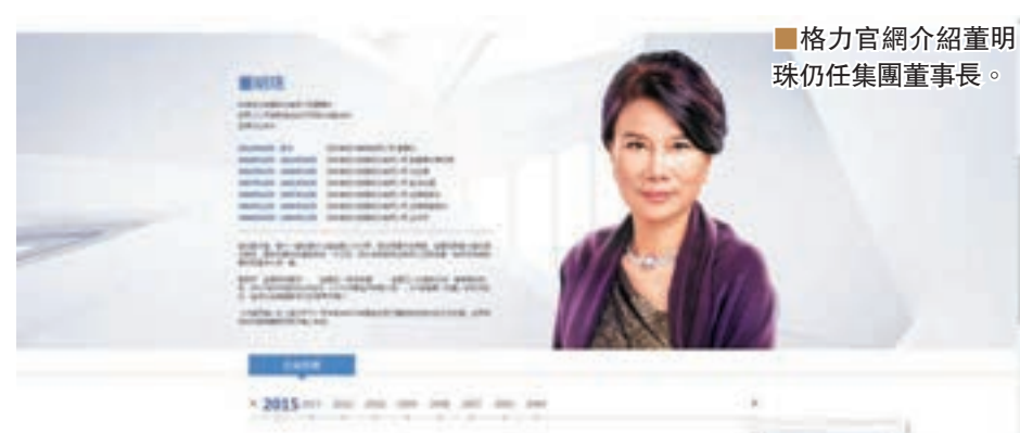
■格力官網介紹董明珠仍任集團董事長。

該負責人稱,按照規定,上市公司和所屬集團的董事長一般是不能兼任的,「現在國資委是在慢慢理順這個關係,是正常的人事調整,不會影響到格力電器的經營」。格力集團新任董事長人選目前並未公佈。