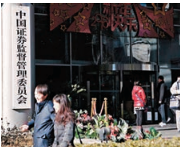
■中證監近日發佈實施了《證券期貨業信息系統審計指南》。

香港文匯報訊(記者 張曉 北京報道)中證監新聞發言人張曉軍11日表示,近日證監會發佈實施了《證券期貨業信息系統審計指南》,對相關行業信息系統的規劃