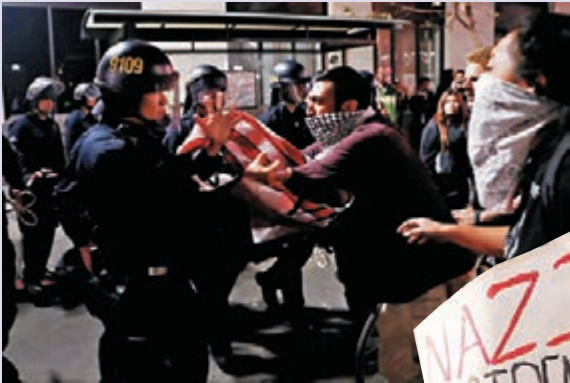
■加州示威者與警方推撞。 路透社

特朗普勝選後，全美各地多個城市均有民眾舉行「反特」示威，其中俄勒岡州波特蘭前晚約有4,000人示威，高呼「向法西斯主義者說不」、「不要仇恨」及「革命」等口號，有人塗污建築物外牆、投擲雜物及搗毀汽車，部分人更用棒球棍襲擊警員及放火。當局宣佈當地爆發暴動，警員發射橡膠子彈及催淚氣體驅散滋事者，最少拘捕29人，又封鎖5號及84號州際公路部分路段，防止騷亂蔓延。加州奧克蘭前晚約有1,000人在市中心非法集會，部分人堵塞580號州際公路，當局施放催淚氣體，拘捕最少兩人。洛杉磯、三藩市、費城、丹佛及首都華盛頓等地均有大批民眾示威。在特朗普家鄉紐約市，示威者前晚再次在特朗普大廈外聚集示威。特朗普選後首度透過微博twitter發文，形容針對他的示威非常不公平。他斥責「專業示威者」在媒體煽動下鬧事。不過到了昨日，他的態度大扭轉，在twitter稱：「我欣賞一小部分示威者對國家展現的熱情……我們會團結起來並感到自豪！」 ■美聯社/路透社/美國有線新聞網絡