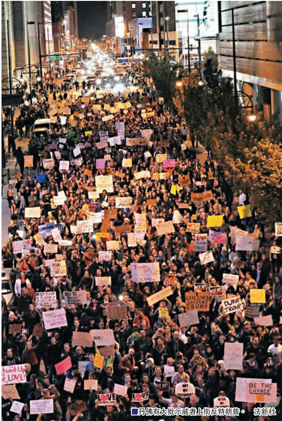
■見佛有大批示威者上街反特朗普。 法新社

朱克伯格指出，「過濾泡沫」的根本問題在於，網民只會「讚好」符合自己觀點的內容，首頁內容因此愈來愈接近用戶的喜好，相反的意見其實一直都在fb上，只是網民視而不見，不願點擊閱讀，對此fb也無能為力。電子傳媒中心「Tow」的調查主任沃德爾指出，fb用戶還會因為政治立場不同，取消追蹤朋友甚至家人的賬戶，導致吸收新資訊的渠道愈來愈狹窄，違背fb起初「拉近人與人之間距離」的宗旨。 ■《衛報》/法新社/《紐約周刊》