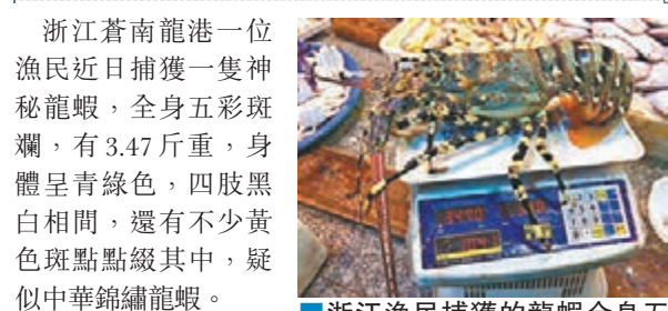
■浙江漁民捕獲的龍蝦全身五彩斑斕。

浙江蒼南龍港一位漁民近日捕獲一隻神秘龍蝦，全身五彩斑斕，有3.47斤重，身體呈青綠色，四肢黑白相間，還有不少黃色斑點點綴其中，疑似中華錦繡龍蝦。