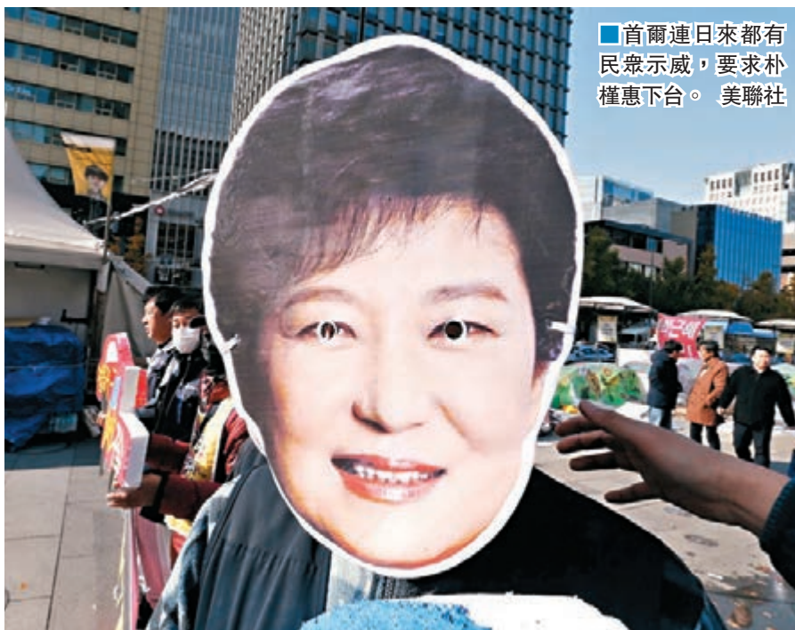
■首爾連日來都有民眾示威，要求朴槿惠下台。

韓國總統朴槿惠「閹蜜干政」醜聞引發的示威浪潮持續，1,500多個公民團體定於今日下午在首爾舉行第三輪燭光集會，要求朴槿惠下台。主辦方估計將有50萬到100萬人參加集會，有望超過2008年6月敦促政府停止進口美國牛肉時，舉行燭光集會的70萬人規模，創歷史新高，警方則估計有17萬人參加，青瓦台正密切關注相關動向。