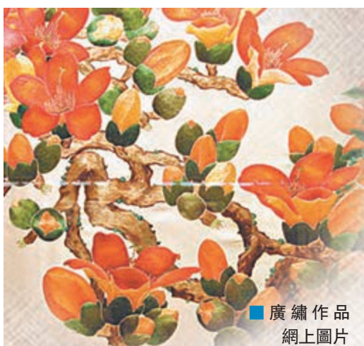
■廣繡作品

古往今來，針線活在大眾的認知裡歷來是巧女獨享的手藝。而在廣繡的發展過程中，它有別於其他三大繡派，在歷史上是以前男繡工為主角，民間故事裡關於廣繡技藝「傳男不傳女」的故事也是層出不窮。昨日，記者在白雲機場廣繡風頒獎儀式上獲悉，近年不斷推廣的廣繡技藝上，男學員逐漸增多，不少新「繡工」的作品開始嶄露頭角。