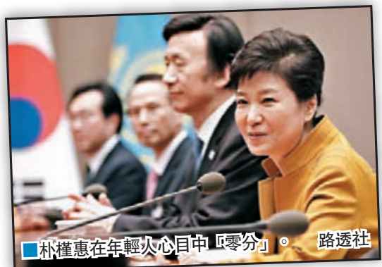
■朴槿惠在年輕人心目中「零分」。

韓國總統朴槿惠「閹蜜干政」醜聞引發的示威浪潮持續，1,500多個公民團體定於今日下午在首爾舉行第三輪燭光集會，要求朴槿惠下台。主辦方估計將有50萬到100萬人參加集會，有望超過2008年6月敦促政府停止進口美國牛肉時，舉行燭光集會的70萬人規模，創歷史新高，警方則估計有17萬人參加，青瓦台正密切關注相關動向。