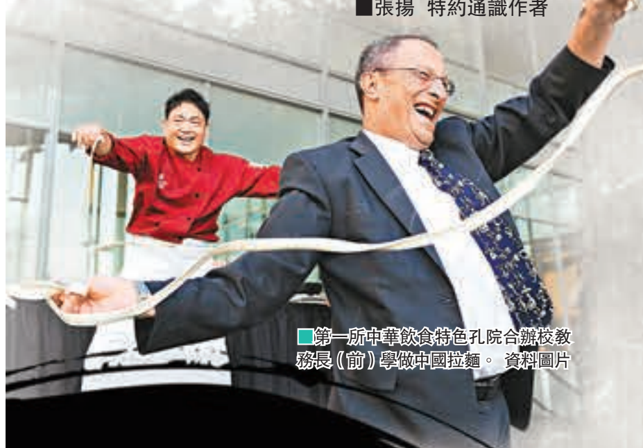
■第一所中華飲食特色孔院合辦校務長(前)學做中國拉麵。資料圖片