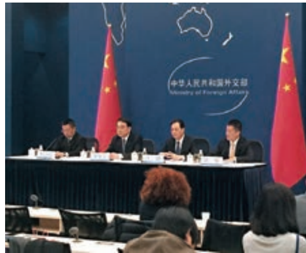
外交部昨日舉行中外媒體吹風會,介紹習近平訪拉美三國有關情況。

張向晨表示,中方期待利馬會議取得如下經貿成果:第一,如期完成亞太自貿區集體戰略研究,提出進一步實現亞太自貿區的政策建議。第二,繼續深入落實北京會議相關成果,推動互聯互通和全球價值鏈合作。第三,支持亞太地區包容性增長,推動在服務業、中小企業等領域取得新的合作成果。