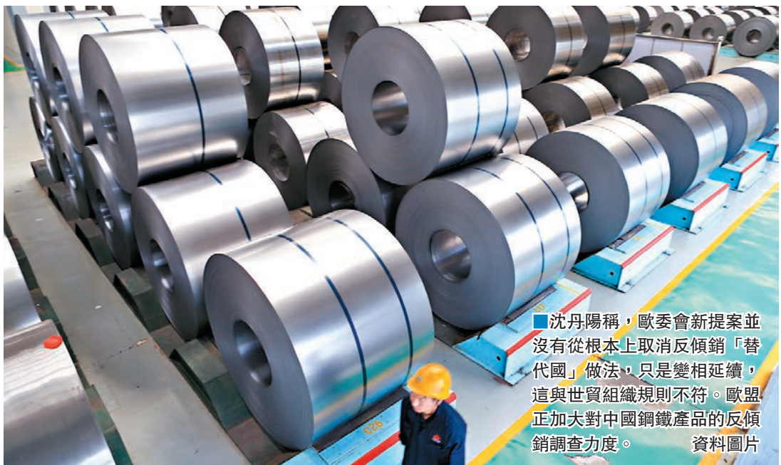
沈丹陽稱,歐委會新提案並沒有從根本上取消反傾銷「替代國」做法,只是變相延續,這與世貿組織規則不符。歐盟正加大對中國鋼鐵產品的反傾銷調查力度。 資料圖片