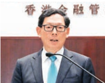
香港金管局總裁陳德霖。

路透社引述金管局總裁陳德霖表示，美國總統選情出乎市場意料，金管局留意到今天環球股市和外匯市場大幅波動。儘管環球市場波動，港元和離岸人民幣的利率和匯率仍然保持穩定，銀行同業貨幣市場繼續運作順利，沒有明顯的收緊跡象。「一如以往，在有需要時金管局隨時可以為銀行體系提供流動性支持」。他預期市場波動短期內持續，直至美國新政府的政策立場更為清晰，並敦促公眾在這段期間保持警覺及審慎管理風險。中銀香港高級經濟研究員應堅撰文指出，長期看，特朗普當選有可能增加人民幣貶值