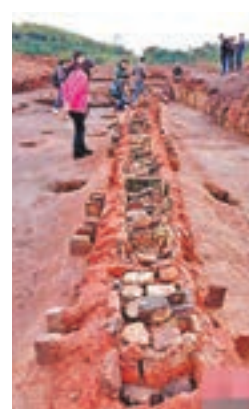
■ 冶煉作坊中的槽形爐。

桐木嶺遺址位於桂陽縣仁義鎮大坊村爐沙坪組，從高處俯視，這處山體台地呈「品」字形，分佈有一個焙燒功能單元和兩個冶煉單元。主持此次考古發掘的領隊、湖南省文物考古研究所專家莫林恒介紹，當時鑄造礦料要先運輸至焙燒區進行粗加工，然後再分送至冶煉單元的冶煉作坊裡精煉。