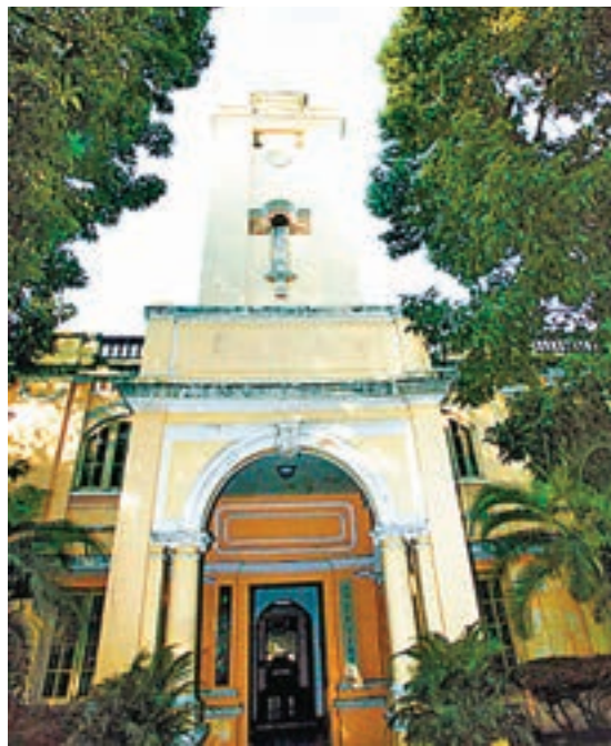
■ 中國國民黨第一次全國代表大會廣州舊址。 網上圖片