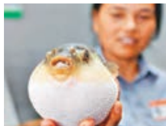
■ 兩種河豚料月底可在內地「合法」食用。