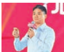
■ 京東集團創始人劉強東。

「雙十一」購物狂歡當前，電商大佬、京東執行長劉強東改變「霸道總裁」形象，開啟暖男的隱藏技能，今日在手機京東直播下廚做飯，並與費玉清、潘瑋柏、張韶涵等40餘名明星，連續12小時直播明星表演與京東送貨，谷旺購物節人氣。