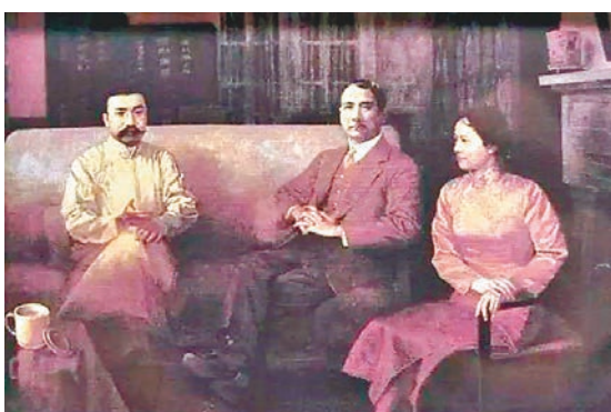
■ 孫中山在廣州主持召開中國國民黨第一次全國代表大會。