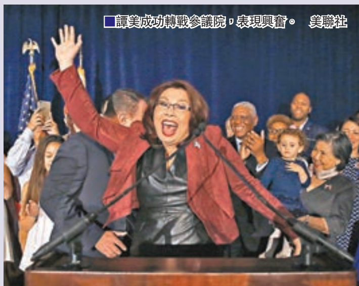
譚美成功轉戰參議院，表現興奮。