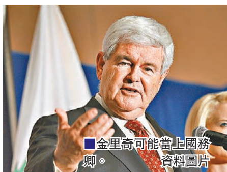
金里奇可能當上國務卿。

特朗普勝出大選後，各界關注他的管治團隊人選。美國全國廣播公司(NBC)引述3名特朗普陣營顧問指，不少資深政客均可能入閣，例如前眾議院議長金里奇可能出任國務卿，退役中將弗林出任國防部長或國家安全顧問，前紐約市長朱利亞尼則可能執掌司法部。金里奇、弗林及朱利亞尼均是少數公開支持特朗普的共和黨人，大有「派餅仔」的味道。