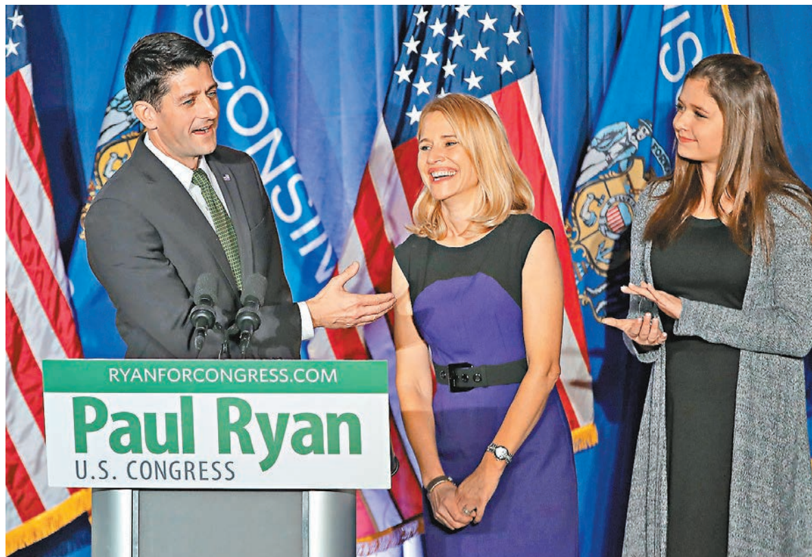
瑞安在確定連任眾議員後與家人會見支持者。