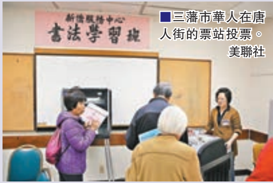
三藩市華人在唐人街的票站投票。