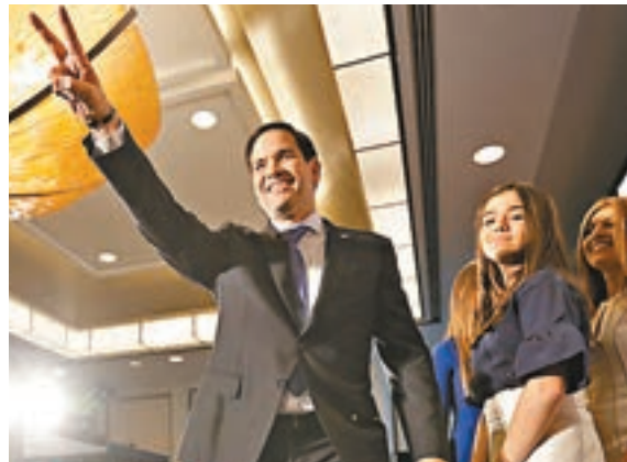
初選敗給特朗普的魯比奧，保住參議院席位。