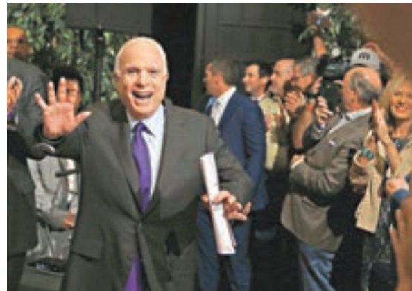
年屆80的參議員麥凱恩再度連任。