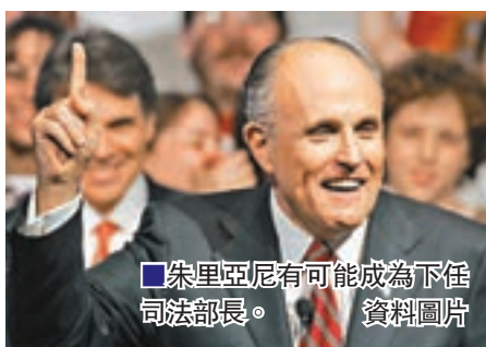
朱利亞尼有可能成為下任司法部長。