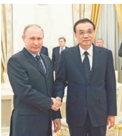
■李克強在莫斯科會見普京。

在「俄羅斯24」電視台採訪中提到，普京近期提出了建立大歐亞夥伴關係的想法，俄羅斯和中國可能成為大歐亞夥伴關係的核心。歐亞經濟聯盟、上合組織、東盟國家未來可能加入這個夥伴關係。根據俄羅斯總理梅德韋傑夫和李克強的會談結果，已授權專家就這一潛在在大歐亞夥伴關係提供技術經濟論證及細節。