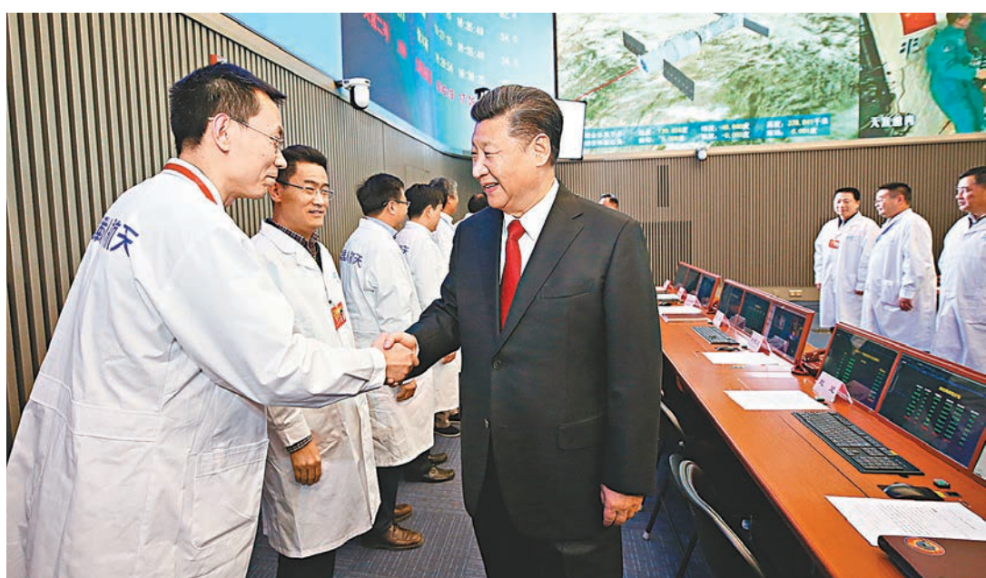
■習近平與中國載人航天工程指揮中心現場參試人員親切握手。新華社

首次執行太空任務的陳冬隨後報告說，已適應了太空的失重環境，飲食起居都很正常，工作也在按計劃進行，「我一定再接再厲，圓滿完成好後續任務」。