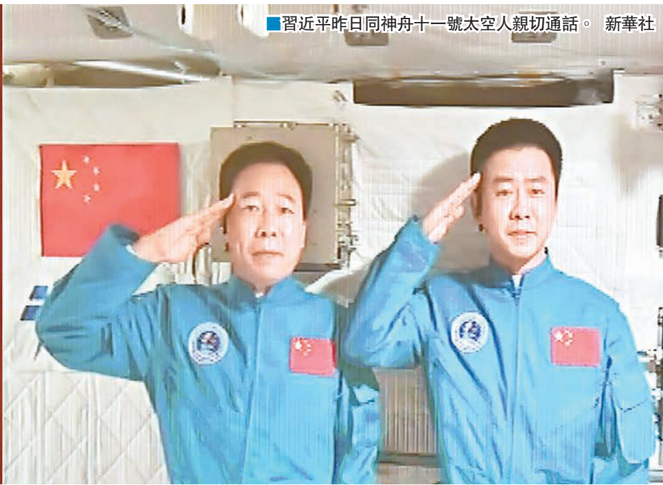
■習近平昨日同神州十一號太空人親切通話。

昨日下午四時許，習近平來到指揮中心。這時，巨型電子屏幕上，清晰地顯示着天宮二號內的實時畫面，景海鵬、陳冬正在開展機械臂機協同在軌維修技術試驗。隨着地面發出指令，景海鵬、陳冬放下手中工作，來到視頻通話位置立正站好。