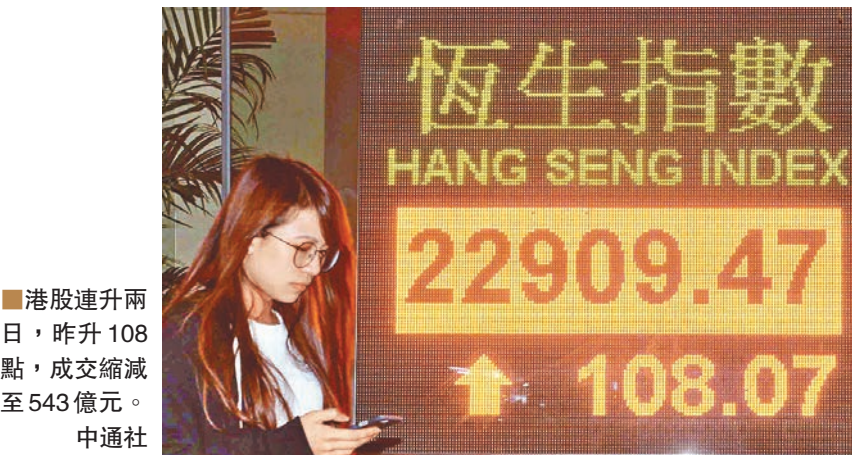
■港股連升兩日，昨升108點，成交縮減至543億元。 中通社

是次研討會由香港金管局基建融資促進辦公室（IFFO）主辦，題為「金立群行長談亞投行營運及基建項目」，吸引了近300位來自金融、建築設計、建築工程、項目管理與諮詢，項目發展與營運，以及其它專業服務領域的業界領袖出席。金立群在會上表示，亞投行計劃在合適的時候發行債券，支持基建融資。「作為世界級的金融中心，香港擁有穩健的商業基建及成熟且活躍的資本市場，亞投行在發債時必定考慮利用香港在這方面的專長。」