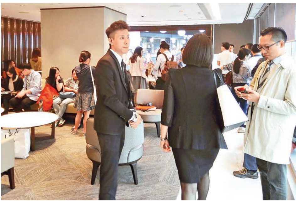
來自西北、東北和華南等地客戶將保誠大廳擠滿，許多客戶因沒有空位只得長時間站着。

記者比較兩地保險公司的相關保障條款，香港保險無論從保費、保額和保障範圍等方面，目前都較內地具有優勢，相信這也是香港保險吸引大量內地客的重要原因。 目前內地保險對於每一種疾病的定義都比香港更嚴格，也就是說，如在原位癌、中風和冠狀動脈手術等，內地保險要求患者的病情達到更嚴重的程度才能理賠。