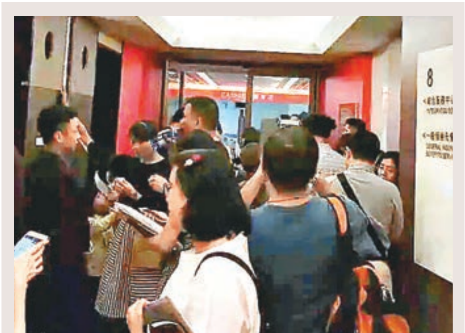
內地客擠滿了保誠保險香港總部大樓。