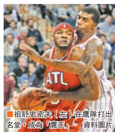
祖舒史密夫(左)在鷹隊打出名堂,成為「鷹王」。資料圖片

據鳳凰體育消息,CBA球隊四川男籃已與前NBA球員祖舒史密夫達成協議,史密夫將在本週末趕往成都與球隊匯合。