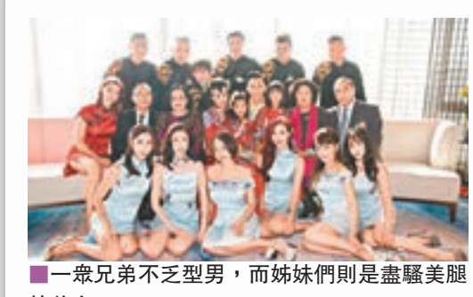
一眾兄弟不乏型男，而姊妹們則是盡騷美態的美女。