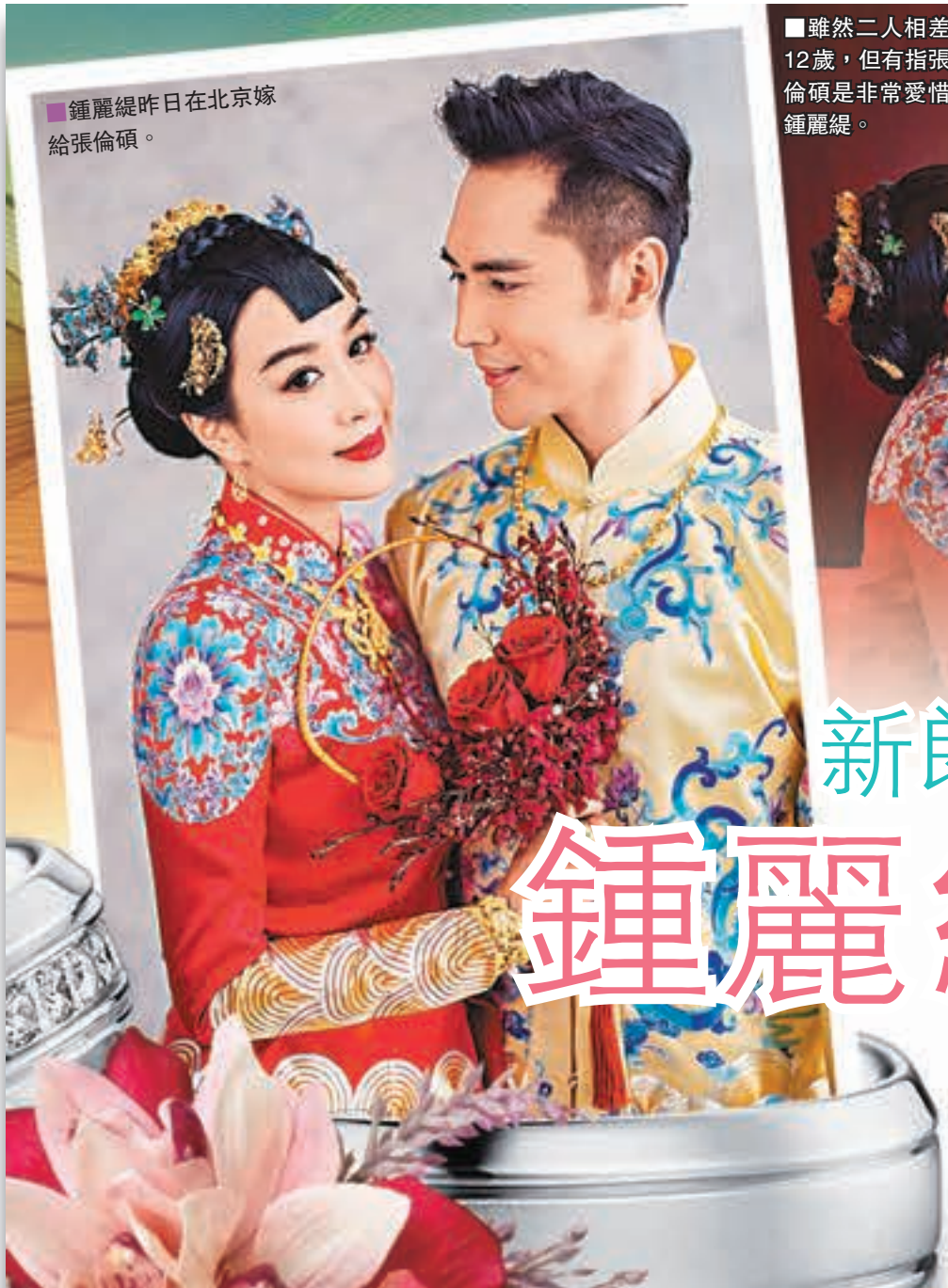
鍾麗緹昨日在北京嫁給張倫碩。