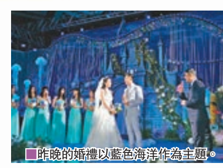
昨晚的婚禮以藍色海洋作為主題。