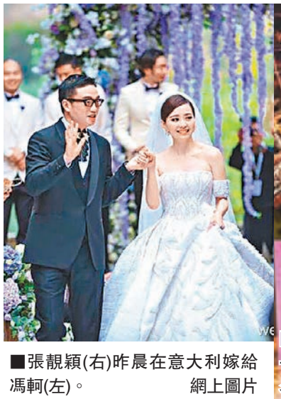
張靚穎(右)昨晨在意大利嫁給馮軻(左)。

身在成都的張母跟傳媒表示：「邀請的事馮軻沒任何表示，靚穎也沒說什麼，因為他們結婚的事，我很心痛，心情低落。」而張母狀告馮軻的官司已屆一審階段，之後便是法律程序。張母又稱她仍持有張靚穎的戶口簿，這段婚姻關係是否獲內地部門承認仍屬未知數。說回婚禮，出席嘉賓包括新娘子的「超女」戰友周筆暢和女星唐嫣，而採用紫色作為主色調的會場佈置得充滿古典風味。