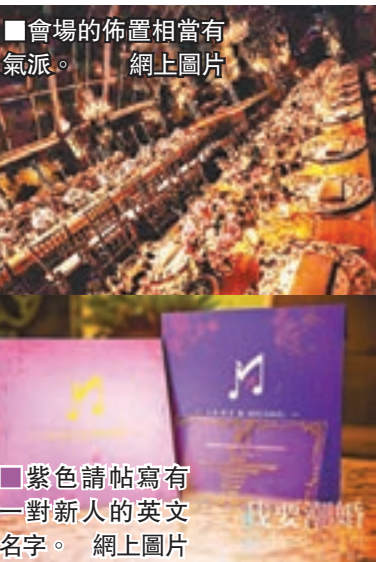
會場的佈置相當有氣派。