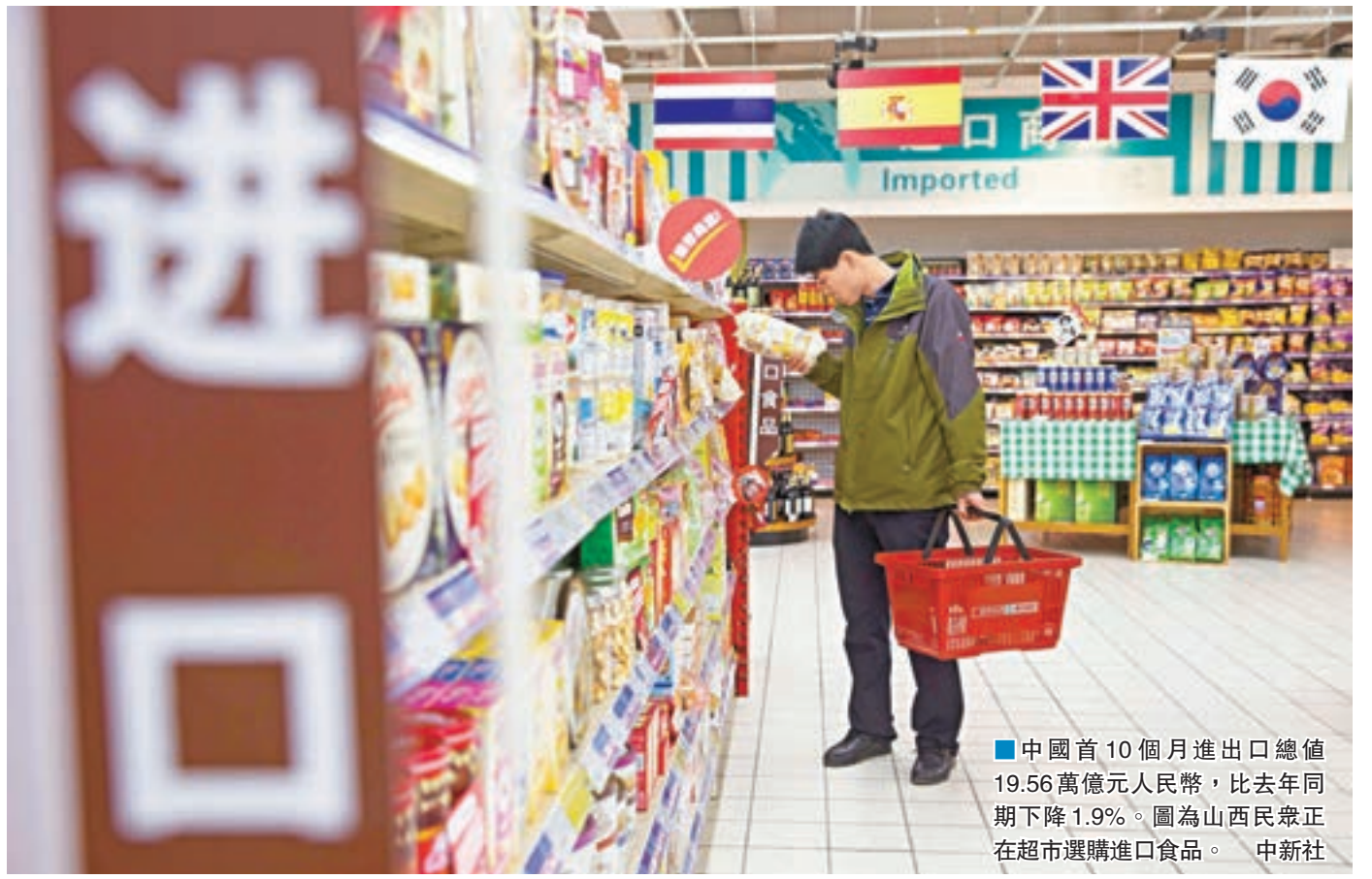
■中國首10個月進出口總值19.56萬億元人民幣,比去年同期下降1.9%。圖為山西民眾正在超市選購進口食品。