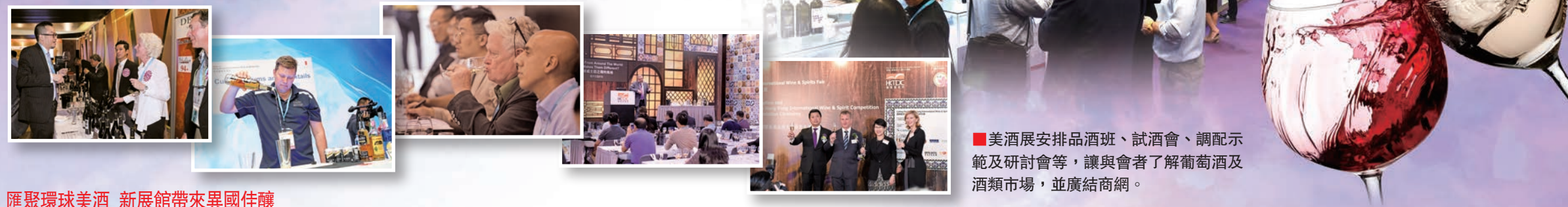
美酒展安排品酒班、試酒會、調配示範及研討會等,讓與會者了解葡萄酒及酒類市場,並廣結商網。