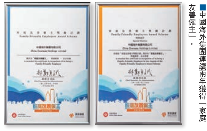
中國海外集團連續兩年獲得「家庭友善僱主」。

兩年一度的「家庭友善僱主獎勵計劃」於2011年首次舉辦，旨在嘉許重視家庭友善精神的僱主，表揚和鼓勵他們繼續推行對家庭友善的僱傭措施，以喚起僱主對家庭核心價值重要性的關注，並締造有利家庭的文化和環境。為了讓員工兼顧工作與生活平衡，集團除了推行五天工作週，更提供不同性質的假期配合員工需要，包括男士有薪侍產假、結婚休假、節慶假(節日員工可提早下班)、恩恤假等，讓員工能夠安心投入工作，減輕壓力，促進企業業務發展。集團亦非常重視員工的身心健康，為加強員工的凝聚力，每年均會舉行活動如「中國海外」內地香港學生夏令營、「中國海外」兩地學生藝術創作交流等，鼓勵員工與家人一同參與，讓員工與家人共聚天倫。此外，集團亦不定期舉辦各類興趣班和康樂活動，如種植班、長跑訓練班、郊遊遠足、每周免費羽毛球活動及各類型運動競賽等。而集團深信員工是企業重要的資產之一，為了挽留人才，集團為員工提供多個渠道與員工交流，增強溝通，加強員工對集團的歸屬感。作為企業社會公民，中國海外集團除了關顧員工外，亦致力履行社會責任，成立「中國海外愛心基金會」，相繼在中國內地貧困地區捐資助建了11所「中國海外」希望小學，並獲聯合國一環球愛心企業、綠色辦公室獎勵計劃，以及連續7年獲頒發商界展關懷標誌等。