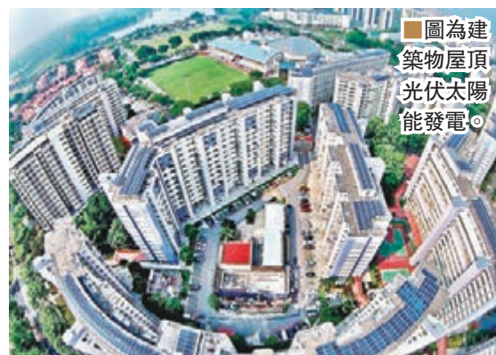
圖為建築物屋頂光伏太陽能發電。

增長力度仍持續走揚。而在巴黎氣候協定11月起生效，減碳環保議題成為各國政府及企業的積極努力施政方向，納入減碳、環保為主的ESG資產也受到投資界重視，流入的資金部位連年增長。