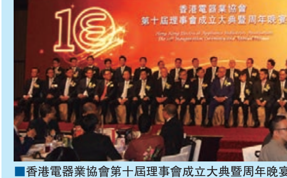
香港電器業協會第十屆理事會成立大典暨周年晚宴日前假香港洲際酒店隆重舉行。

創新及科技局副局長鍾偉強博士向第十屆理事會全體成員頒發委任狀。此外，隨著移動通訊技術及設備的進步，用戶對家電及智能電話或平板電腦之間的連接有更大的關注，香港電器業協會跨越地域的界限，在早前舉辦第一屆大中華智能家電設計大賽，並於當晚揭曉比賽結果，大會共頒發十多個獎項予來自內地、香港及台灣地區的得獎者。