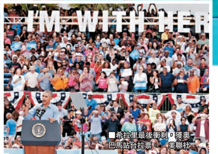
希拉里最後衝刺，獲奧巴馬站台拉票。