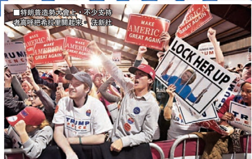
特朗普造勢大會上，不少支持者高呼把希拉里關起來。