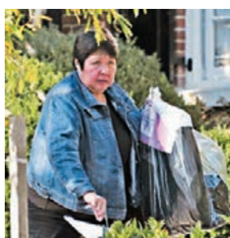
希拉里多次吩咐桑托斯打印敏感機密。網上圖片

FBI問話時承認，希拉里因工作關係在寓所設立高度設防的「敏感訊息隔離設施」(SCIF)，但桑托斯可在無須接受任何檢查下入內。