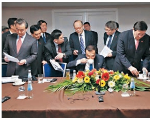
李克強喝一口咖啡提神。

在拉脫維亞首都里加短短兩天，李克強總理不僅正式訪問拉脫維亞、出席「16+1」領導人會晤、中國—中東歐經貿論壇等近10項活動，還在活動間隙「見縫插針」密集完成了17場雙邊會見。會見室門口一度出現「摩肩接踵」的景象。