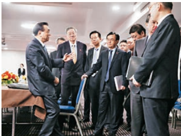
在會談間隙，李克強與部長們爭取時間磋商。