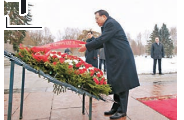
李克強來到比斯卡廖夫公墓向紀念碑獻花圈。