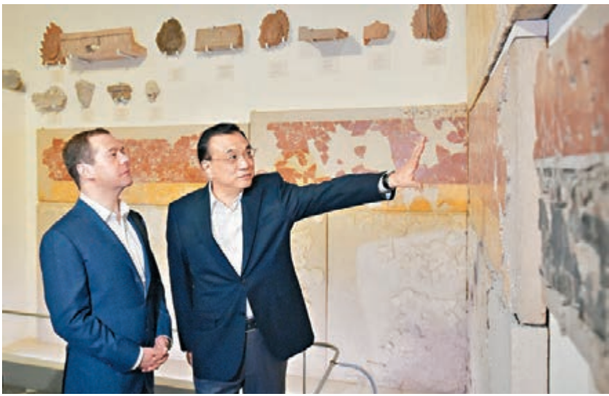
當地時間6日晚，李克強在梅德韋傑夫陪同下參觀聖彼得堡艾爾米塔什博物館。