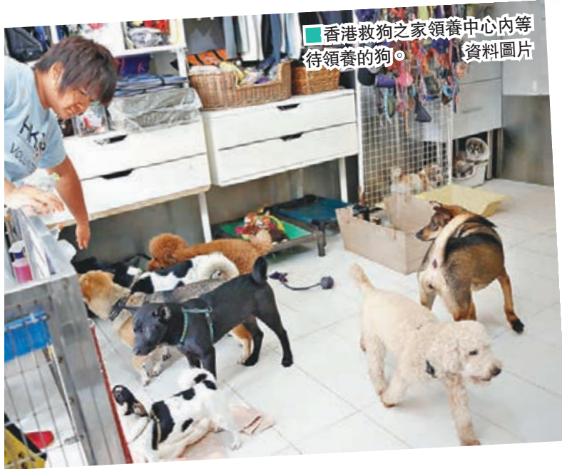
■ 香港救狗之家領養中心內等待領養的狗。

最大的道德問題是，人道毀滅佔接收遺棄寵物總數的百分比相當驚人。愛協的2014/2015年度數據顯示，等待領養及人道毀滅的寵物分別是2,578及2,213隻。漁護署在2015/2016年度中人道毀滅的宗數佔超過3,400宗，約佔全年接收總數的一半。