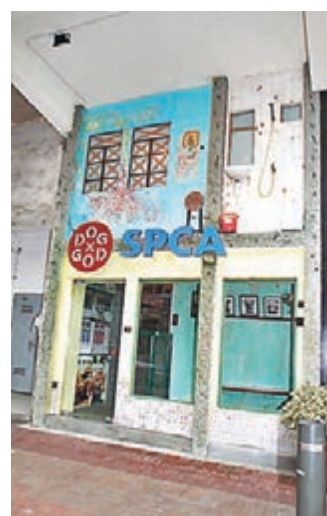
■ 愛協位於西貢的領養中心。