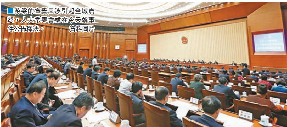
游梁的宣誓風波引起全城震怒，人大常委會或在今天就事件公佈釋法。