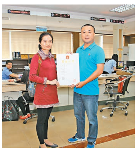
廣東個體工商戶「兩證整合」的新登記制度1日正式實施。

隨着CEPA及相關補充協議的相繼出台，港人在內地開設個體工商戶熱情高漲，其中，廣東更是港人投資重心，開設的港資個體戶佔全國七成，戶均註冊資金亦是內地同行的三倍以上，截至今年10月底，在粵開設的香港居民個體工商戶有6,888戶。不過，不少港人北上投資時，由於辦理部門多、手續繁雜，令不少人尚未經營便先耗費不少人力和資金成本。