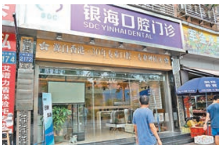
港人在粵開設個體戶辦理手續將減省一半。圖為港資廣州銀海口腔診所。

香港文匯報訊 (記者 敖敏輝 廣州報道) 港人赴粵開設個體商戶再迎利好。記者昨日從廣東省工商局獲悉，從11月起，全省個體工商戶營業執照和稅務登記證「兩證整合」登記制度改革正式實施並即時生效。其中，港澳居民設立的個體工商戶亦包含在內。意味着港人在粵辦理註冊登記、變更個體戶資料等手續，只需前往工商部門，毋須再跑國稅地稅質監等部門，此政策亦將於廣東實施一個月後在全國鋪開。