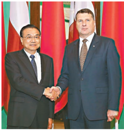
拉脫維亞時間11月4日下午，中國國務院總理李克強在里加總統府會見拉脫維亞總統韋約尼斯。