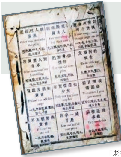
清朝漢字注音的英語書。