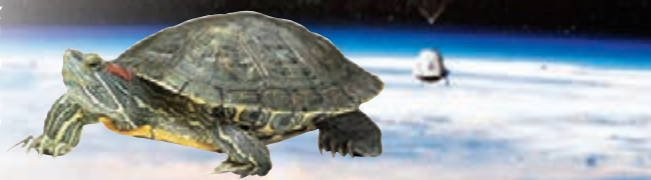
「旅行者2號」放飛效果圖。

該款飛行器驗證版產品目前艙體已完成技術測試，主艙將由一個直徑近40米的超大囊體，攜帶到達20公里以上的臨近空間。據介紹，「旅行者2號」驗證版主艙搭載了經過特殊設計的動力系統，可實現臨近空間極為稀