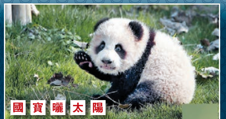
首隻在中國大熊貓保護研究中心上海基地出生的雌性大熊貓寶寶「花生」昨日首度到室外活動場玩耍。「花生」自7月9日出生以來，至今體重已達7,000餘克，生長情況良好。

史料記載，衛國故城俗稱朝歌二道城。朝歌歷史上曾是京畿之地，殷商晚期先後有4位帝王在此建都城。公元前11世紀，殷商滅亡後，朝歌繼而成為衛國國都，成為當時中國最大的一個諸侯國。 ■中新社