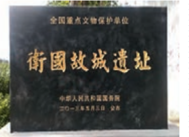
衛國故城曾是周代最大諸侯國都城。

衛國故城所在地河南淇縣已經啟動衛國故城保護設施建設項目，衛國故城曾經是中國周王朝時期最大一個諸侯國的都城。該項目計劃投資近800萬元人民幣，一方面完善文物保護利用設施，促進衛國故城的文物保護及利用工作；另一方面通過籌建衛國故城考古遺址公園來展示朝歌的昔日繁盛景象，方便民眾參觀、學習。