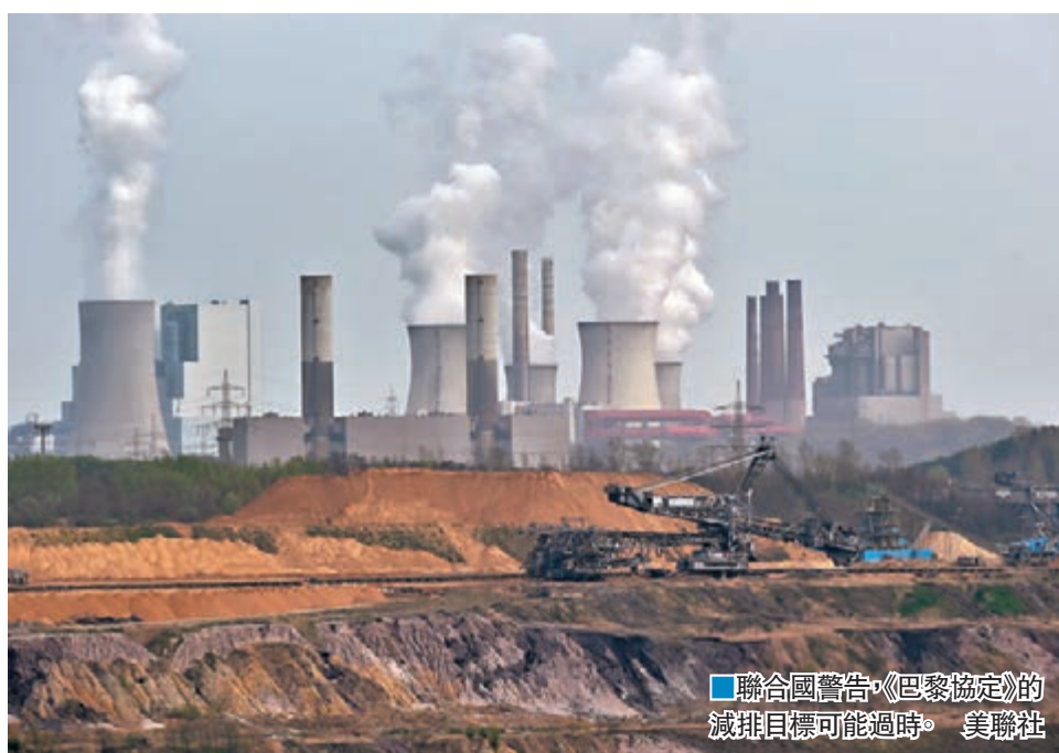
聯合國警告，《巴黎協定》的減排目標可能過時。

是人類在戰勝氣候變化威脅上的歷史轉折，並希望透過新一次大會，繪製出發達國家在2020年前，達到每年提供1,000億美元(約7,756億港元)氣候資金