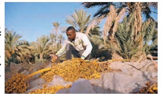
暖化加劇沙漠化。圖為摩洛哥正乾涸的綠洲。

習近平強調，中國於今年4月22日《巴黎協定》開放簽署首日簽署協定，並於9月3日批准協定。作為主席國，中國推動二十國集團首次發表關於氣候變化問題的主席聲明，為推動簽署《巴黎協定》提供政治支持。《巴黎協定》開啟了全球合作應對氣候變化新階段。中國堅持創新、協調、綠色、開放、共享的發展理念，將大力推進綠色低碳循環發展，採取有力行動應對氣候變化。中方願同各方加強溝通合作，為構建合作共贏、公正合理的全球氣候治理機制作出貢獻。 ■新華社