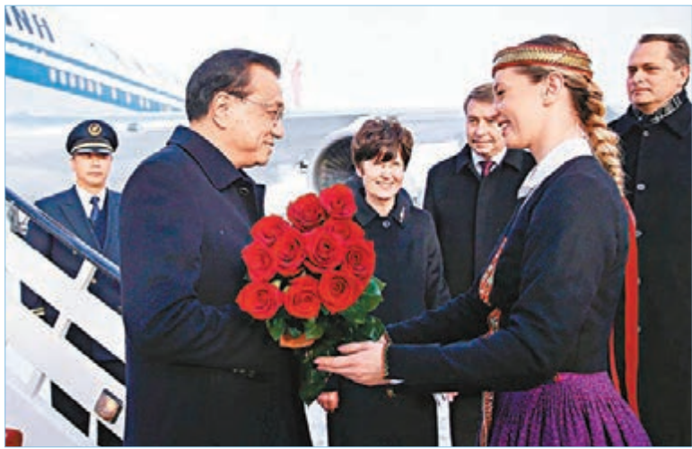
李克強抵達拉脫維亞，接受當地青年獻上鮮花。 網上圖片