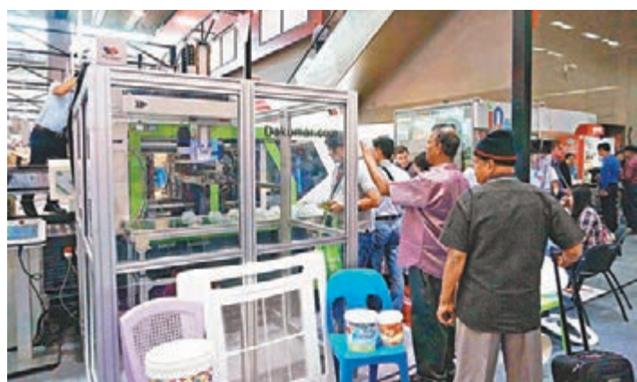
廣交會現場，採購商在諮詢展品。

通過廣交會達成的成交額約佔其全年出口額的比例高達47.9%。進口功能也不斷增強。