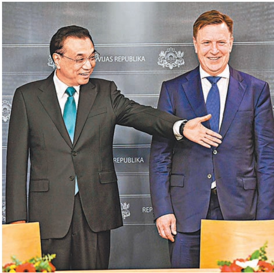
李克強同拉脫維亞總理庫欽斯基舉行會談。圖為兩國總理準備見證雙邊合作文件的簽署。

香港文匯報訊 應拉脫維亞共和國總理庫欽斯基邀請，中國國務院總理李克強於當地時間4日上午乘專機抵達里加國際機場，5日出席第五次中國—中東歐國家領導人會晤，並對拉脫維亞進行正式訪問。據新華社報道，李克強在里加總理府同庫欽斯基舉行會談。李克強指出，中方願同拉方全面深化各領域務實合作，稱中方在鐵路、港口建設領域擁有性價比好的裝備和豐富經驗，願參與波羅的海鐵路、三海港口（亞得里亞海、波羅的海和黑海）等基礎設施建設和產能合作。會談後，兩國總理共同見證了經貿、交通、文化等領域雙邊合作文件的簽署。