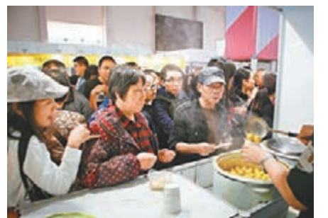
寧波市民排隊購買香港傳統小吃咖喱魚蛋。

港自創潮牌參展。由香港年輕人創辦的ad-lib主要做戶外用品，第一次到寧波進行展銷。參展人員給記者展示一把戶外便攜椅子，下面可放飲品，還能保溫。展會的另一大亮點是VR（虛擬實景）體驗區，戴上特製眼鏡即如置身香港大街小巷。