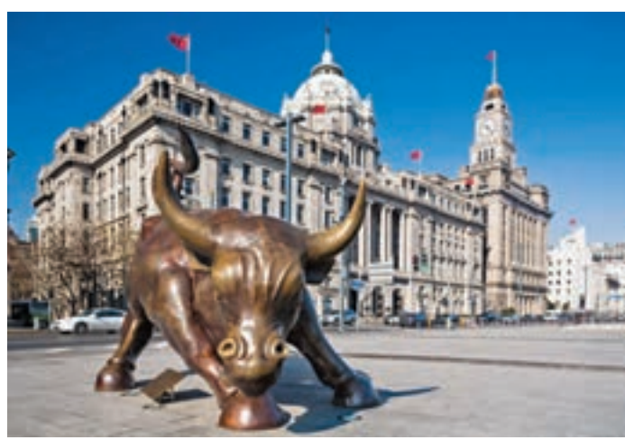
中國經濟有跡象走出谷底回升,有利資金回流A股市場。

中國官方日前發佈消息指出,養老保險基金委託投資合約已經印發,年內將公佈第一批養老基金管理機構,正式啟動運營,券商估計養老金入市將給A股帶來6,000億元人民幣的長線資金。此外,深港通預估將在本月底前開通,徐百毅建議,可留意具新經濟概念的深圳A股與香港中小型股或聚焦科技創新概念題材。