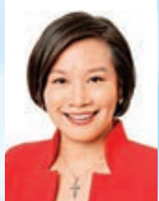
梁美芬女士 香港立法會議員, SBS,博士,太平紳士