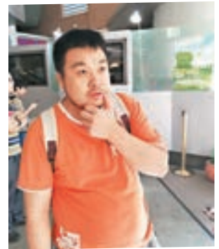
翁先生希望「博一博」。