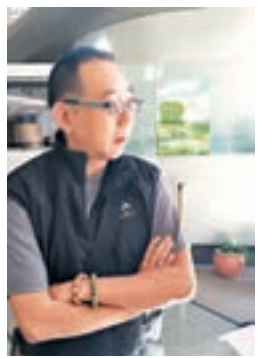
盧先生希望母親住得更舒適。

翁先生目前一家六口租住屯門私樓,個人月入逾萬元,每月租金近1.5萬元,坦言經濟壓力沉重,慨嘆輪候公屋遙遙無期,申請數次居屋落空,雖然認為景泰苑半數單位面朝馬路,並非最好選擇,但輪不到公屋,又不想捱貴租,形容是「迫不得已的選擇」,希望成功「博一博」。他直言「用得錢買,單位面向不好或平台都不會選擇。」