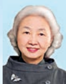
梁愛詩女士 香港基本法起草委員會副主任 GBM,博士,太平紳士