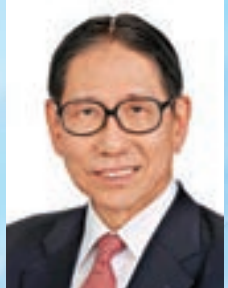
梁智鴻醫生 GBS,太平紳士