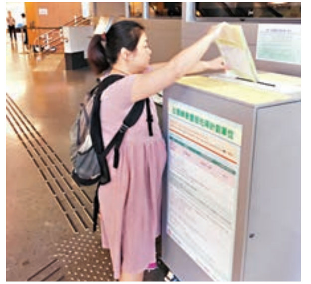
合資格綠表人士把握機會交表。

首個專為綠表人士而設的景泰苑共有857個單位,單位面積由192平方呎至494平方呎,售價由94萬元至298萬元,平均呎價5,658元,房委會以市價六折出售,以最便宜94萬元開放式單位計算,首期最平4.7萬元便可「上車」,項目於今年12月攪珠,明年1月揀樓,明年中入伙。