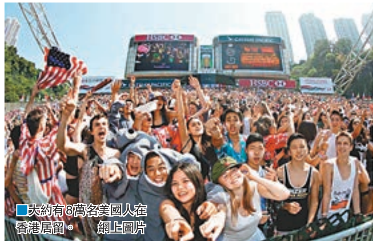
■大約有8萬名美國人在香港居留。