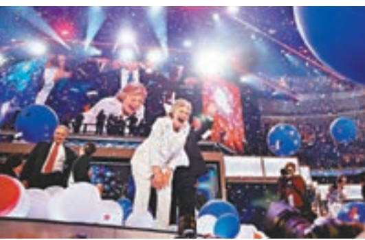
林頓始終擺脫不了性醜聞的陰影，墨涵覺得即使希拉里上台執政，恐難逃政敵繼續就「電郵門」發起狙擊。

無論誰是誰非，墨涵認為「電郵門」難以對選情構成重大影響，畢竟選民已大致決定好支持哪位候選人。然而，考慮到過去二十年來，前總統克林頓始終擺脫不了性醜聞的陰影，墨涵覺得即使希拉里上台執政，恐難逃政敵繼續就「電郵門」發起狙擊。