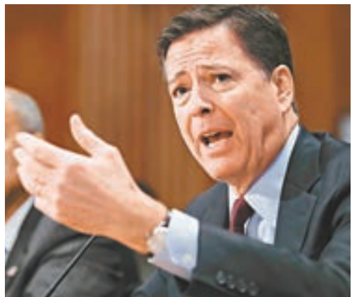
■FBI局長高銘被指偏袒特朗普。資料圖片

「維基解密」前日再披露希拉里競選陣營的電郵，顯示今年3月希拉里與初選對手桑德斯參加由美國有線新聞網絡(CNN)主持的辯論前，