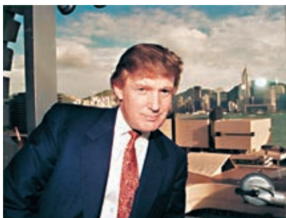
特朗普90年代在港留影。