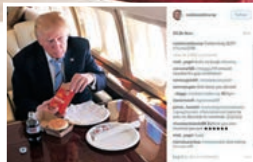
在Instagram分享於私人飛機吃快餐照片。網上圖片