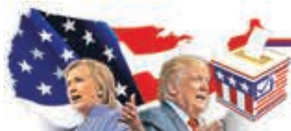
美國大選2016 特朗普家庭篇