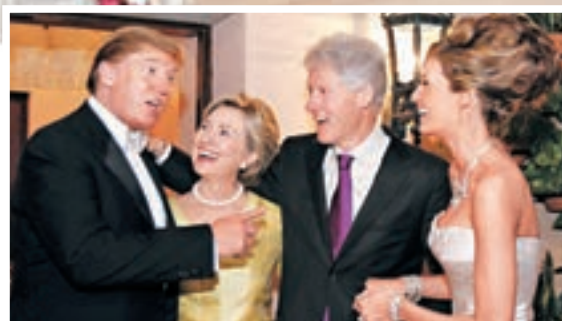
三度結婚的特朗普，曾邀克林頓夫婦出席他與梅拉妮亞的婚禮。