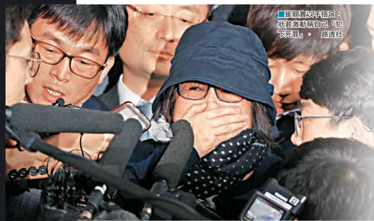
■崔順實以手捂口，狀甚激動稱自己「犯下死罪」。