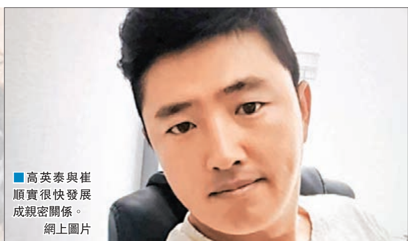
■高英泰與崔順實很快發展成親密關係。