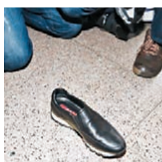
■在混亂間，崔順實的名牌皮鞋被撞甩。