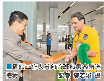
碼頭工作人員向首班船乘客贈送禮物。