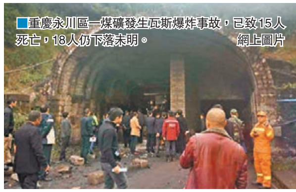
重慶永川區一煤礦發生瓦斯爆炸事故,已致15人死亡,18人仍下落不明。 網上圖片

入夜後,現場周圍都亮起應急照明燈,事故井口周圍醫療人員、武警、消防及通信保障人員仍在現場待命。