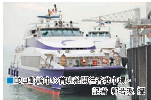
蛇口郵輪中心首班船開往香港中環。