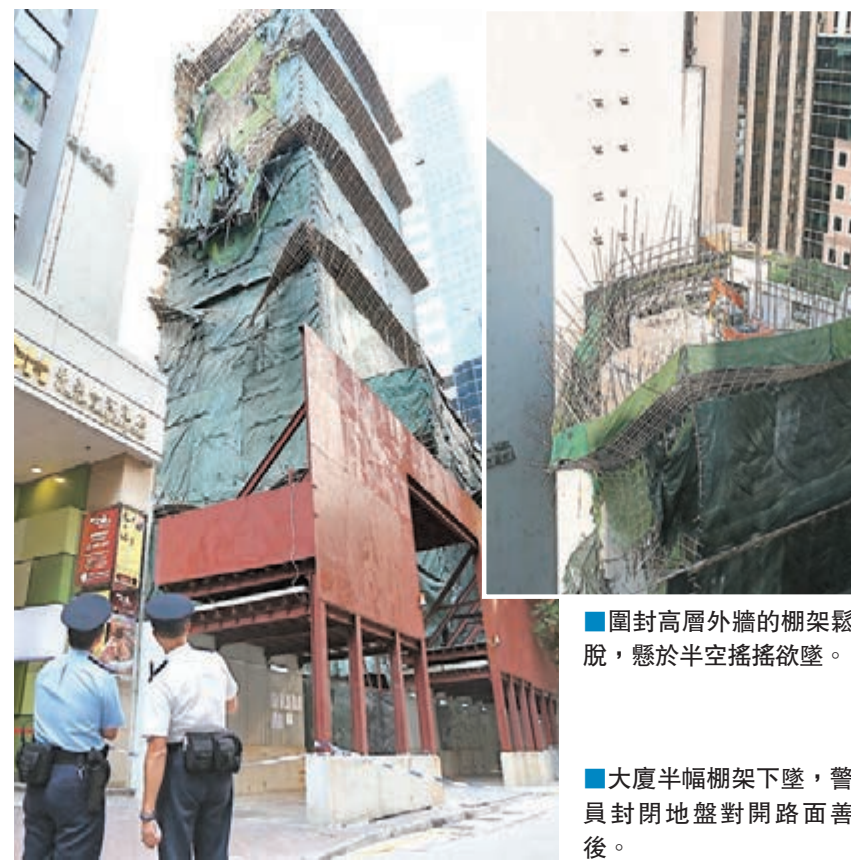
圍封高層外牆的棚架鬆脫,懸於半空搖搖欲墜。 大廈半幅棚架下墜,警員封閉地盤對開路面善後。

大廈一邊外牆,突有一幅約10米乘15米面積棚架鬆脫傾側,懸於半空,部分更下墜殃及對落數層其他棚架,搖搖欲墜,有竹枝連同大量石屎碎片飛墜旁邊的空置地盤地面,發出連串巨響。 屋署證不涉塌牆無危險 現場消息稱,有工人一度以為有大幅拆卸中的圍牆倒塌撞毀棚架,慌忙報警。警員及消防員到場以策安全,立即將對開一段駱克道臨時封閉,並通知屋宇署等部門派員到場調查。其後地盤承建商負責人、大廈業主代表及屋宇署人員先後到場,經小心視察後,屋宇署人員相信意外不涉大廈外牆倒塌,大廈結構亦無即時危險,又指因倒塌範圍在地盤內,須暫時停工,待用圍網圍封後才可繼續施工。 事發時在地盤頂層工作的工友形容,棚架在毫無先兆下「突然間碎,都有嘔過」,其間感覺不到樓宇有震動,相信意外是因上周「落得雨多,响竹霉响」肇禍。