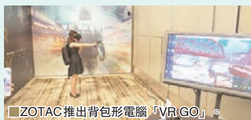
■ ZOTAC 推出背包形電腦「VR GO」。

廣獲機迷推崇的電腦生產商 ZOTAC，上周舉行大型記者會暨「ZOTAC 世界盃邀請賽」，慶祝該公司成立十周年。而更為人注目的是，他們當日披露了四款全新產品，分別是高效能顯示卡、SSD、迷你電腦和最有看頭的 VR 背包「VR GO」。在顯示卡方面，ZOTAC 請來合作無間的 NVIDIA 高層來推介其 GeForce GTX 1080 系列，可見廠方對合作夥伴的重視程度；也有採用液體冷卻裝置的高階電腦機殼，適合耗費電力甚多、配備頂級裝置的高要求玩家。當然，最具話題性是「VR GO」，重約 10 磅的背包形電腦即使小孩子使用，也不會太辛苦，配上眼罩後即能簡單玩到 VR 遊戲，提升遊玩體驗。