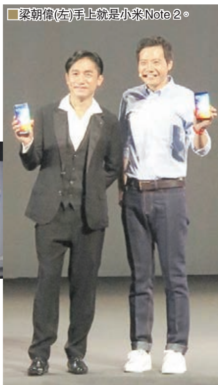
■ 梁朝偉(左)手上就是小米 Note 2。