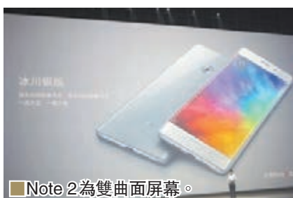
■ Note 2 為雙曲面屏幕。

在機身正面，Note 2 把 OLED 柔性屏與 3D 玻璃合成一起，實現屏幕的 3D 曲面。加上機背的 3D 玻璃，前後雙曲面如玉般晶瑩剔透。亮黑版的黑色 3D 玻璃能反射出最明亮的光，優雅而神秘；冰川銀版強光時像天空，弱光時則像大海。這兩個版本將於 11 月 1 日通過小米商城和小米之家首發開賣，4GB+64GB 和 6GB+128GB 售價分別為人民幣 2,799 元和 3,299 元；全球版(6GB+128GB)則為人民幣 3,499 元。