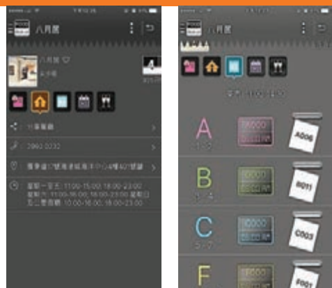
■ 除了茶樓外，Food Gulu 也可預約其他類型食肆的門籌。

和家人去茶樓品茗，最要命並非食肆是否偏僻抑或收費太貴，而是要做孝子一大清早去拿籌等位，而拿籌後又不敢隨便走開，否則過了籌號便要重新排過，得不償失。幸好受惠於科技進步，不少食肆都推出了專屬 App 讓顧客可遙距拿籌，並在 App 中顯示現時排到第幾個籌，臨近到自己的籌號時更會發出提示訊息，非常體貼周到。換言之，可以安坐家中先拿籌，做些家務才出門口，再在商場逛個圈，最後施施然到店子進餐。