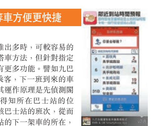
■ 九巴 App 顯示各班車距離目前位置還有多少分鐘。

萬用交通 App 已推出多時，可較容易的「點到點」去找尋搭車方法，但針對指定交通工具的 App 則有更多功能。譬如九巴 App 便可提示候車乘客，下一班到來的車還需等多少分鐘，其運作原理是先偵測閣下手機的 GPS，以得知所在巴士站的位置，再檢查途經該巴士站的班次，從而找出最近該巴士站的下一架車的所在，再推算出其抵達時間。事實上，日本有些城市的巴士系統多年前已採用這種方式，香港近年也有引入，分別在於把推算資料直接傳送到候車人士的手機而已。只是 GPS 有其使用限制，目前九巴並非所有巴士和車站都能對應這系統，暫時過海巴士便無法偵測。此外，香港亦有多個的士 App 讓人預約的士，操作相當簡易，只需輸入現時位置即可找出附近有什麼的士可以效勞，相信較年長者在用上都不會有太大問題。