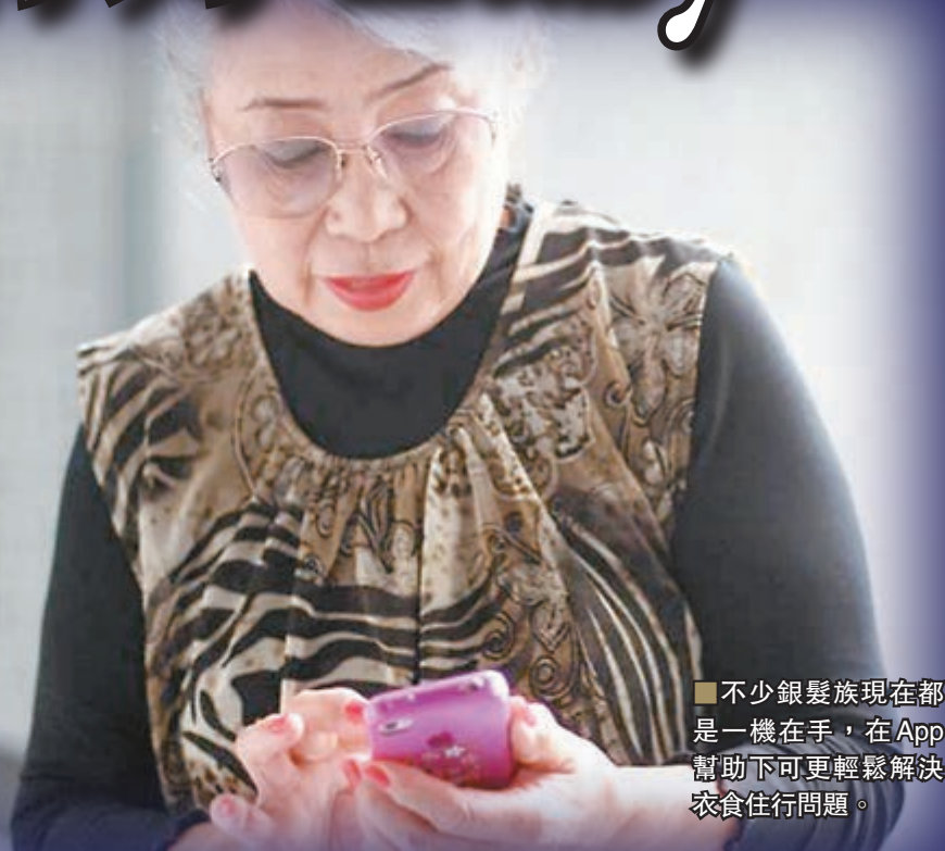
不少銀髮族現在都是一機在手，在App幫助下可更輕鬆解決衣食住行問題。