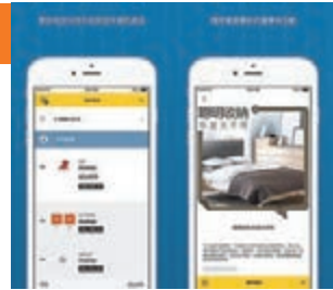
■ IKEA 產品目錄 App 列出各傢具的最新價格。

要親身去看傢具的年代已經過去，因 IKEA 推出了產品目錄 App，顧客可在不前往門市下仍能得悉有什麼新產品和最新抵價優惠。基於傢具店需要較大面積，除了銅鑼灣分店外其餘兩間都不太就腳，令九龍和新界居民頗為不便，所以現在可藉着這公司的 App 來預先選擇，並可抄下想購買的產品編號，以便顧客在門市時直接落單。