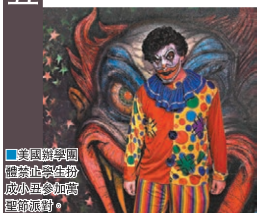
美國辦學團體禁止學生扮成小丑參加萬聖節派對。

惡作劇演變罪案 歐美萬聖節禁小丑 歐美各地近月遭受「嚇人小丑」肆虐，不少人扮成恐怖小丑四出作怪，引起恐慌。萬聖節前夕，情況更是變本加厲，甚至有不法分子借機扮成小丑犯法，情況完全失控。為以防萬一，歐美不少萬聖節活動都禁止參加者扮成小丑。 小學生往往成為嚇人小丑的目標，美國學校區經常接報有小丑徘徊，有見及此，美國至少9個州的辦學團體禁止學生扮成小丑參加萬聖節派對，新澤西州就有校長向家長發信，警告如果有學生穿着小丑服裝便要回家。英國不少酒吧亦禁止小丑裝，並打算增加保安。 嚇人小丑最初於8月在美國南卡羅來納州出現，當時有嚇人小丑引誘兒童走進樹林，未幾這種惡作劇擴散至其餘20多個州，並傳至歐洲、南美及澳洲等地。英國全國防止虐待兒童會(NSPCC)表示，兒童輔導熱線僅3星期內就收到約500宗兒童求助個案，他們均在網上或現實世界中遇上嚇人小丑。NSPCC擔心有變童癖會利用萬聖節變裝派對作掩護，扮成小丑性侵犯兒童。 德國上週至少發生30宗與嚇人小丑有關的襲擊及搶劫案，有職業小丑認為，這些嚇人小丑只是一群嗜血的惡作劇分子，並非帶來歡樂的真正小丑。世界小丑協會明白嚇人小丑引起的憂慮，但認為社會反應過度。 法新社/《華爾街日報》/英國《太陽報》