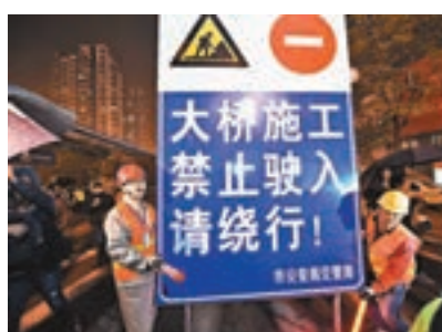
前晚，工作人員在長江大橋南口道路中間放置禁行警示牌，意味大橋暫別南京市民。新華社

江蘇省南京市政府近日公佈了一份《長江大橋公路橋維修改造期間交通組織方案》，根據方案，南京長江大橋於前日(28日)22時起封閉維修，此次維修改造建設工期歷時27個月。長江大橋封閉期間，行人、非機動車和機動車均無法通行。南京市制定了相關的通行方案，方便長江兩岸南京市民的出行。 ■新華社