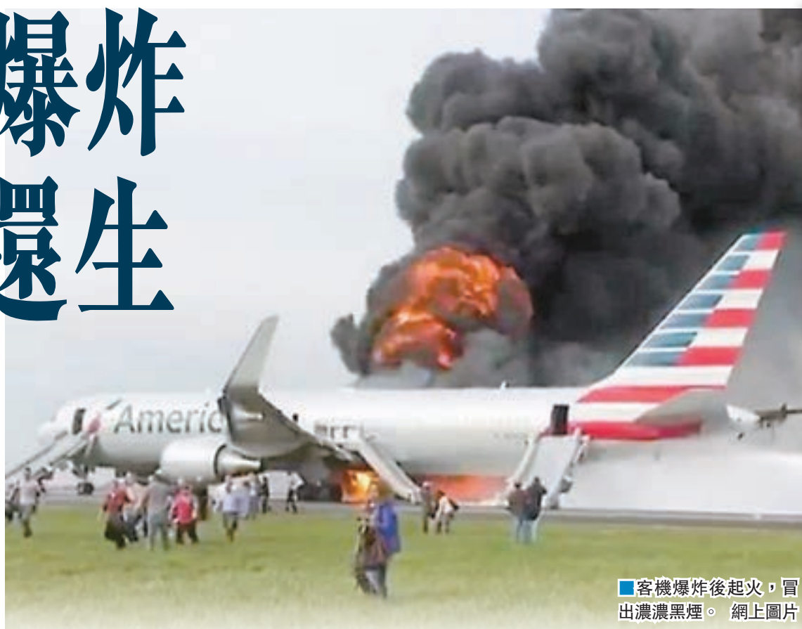
客機爆炸後起火，冒出濃濃黑煙。網上圖片