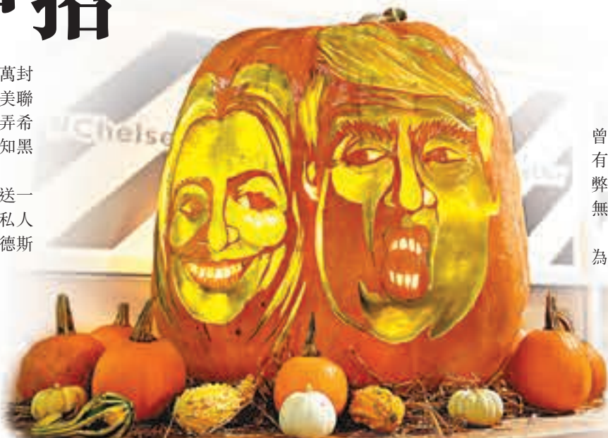
■萬聖節將至，紐約出現刻有希拉리와特朗普肖像的南瓜裝飾。