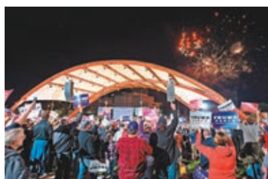
■特朗普陣營在造勢大會上放煙花。

共和黨候選人特朗普自稱坐擁數十億美元身家，更承諾會自掏腰包至少捐出1億美元(約7.75億港元)，贊助自己的競選工程。不過根據聯邦選舉委員會(FEC)最新報告，特朗普至今只捐了6,600萬美元(約5.1億港元)，距離目標金額還差1/3。 特朗普在黨內初選期間投放大量金錢幫自己打選戰，但鎖定提名後捐款額急速下跌，估計每個月平均只有200萬美元(約1,551萬港元)，直至最近才一次過捐出1,000萬美元(約7,755萬港元)。 另一邊廂，希拉里競選經費截至上週還有1.53億美元(約10億美元)，超過特朗普陣營一倍有多。