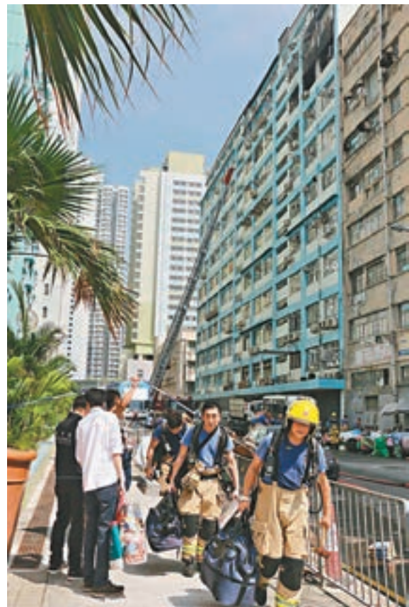
三位消防在今年七月元州街昌發工廠大廈火警中,冒着氧氣耗盡的風險,成功在火場拯救一對兄妹。 資料圖片