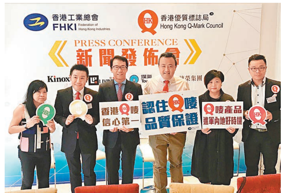
落實參展「Q嘜」企業品牌包括德國寶、雅芳婷、Kinox建築士、捷榮咖啡、中華煤氣及官燕棧等。

香港文匯報訊(記者莊程敏) 內地市民生活水平提升，對本港企業而言發展空間龐大，有見及此，香港工業總會及優質標誌局將於12月23日至1月8日於廣州舉行「品品2016粵港澳工貿推廣及展銷會」，讓粵港澳企業推廣其品牌及產品至內地。 香港優質標誌局主席丁煒章表示，Q嘜優質標誌計劃成立多年，目前有逾150間獲Q嘜認證的企業中，約60間在內地銷售。而過去10年Q嘜認證的產品未有任何安全問題的報道，於內地市場有很高信譽評價。