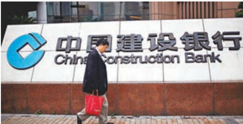
圖為內地的中國建設銀行。

香港文匯報訊(記者歐陽偉昉) 內銀陸續公佈第3季業績，建設銀行(0939)昨公佈該行今年首9個月錄得淨利潤1,946.70億元(人民幣，下同)，歸屬於股東的淨利潤為1,938.35億元，分別較上年同期增長1.35%及1.19%。年化平均股東權益回報率(ROE)17.16%，比去年同期降低2.29個百分點。