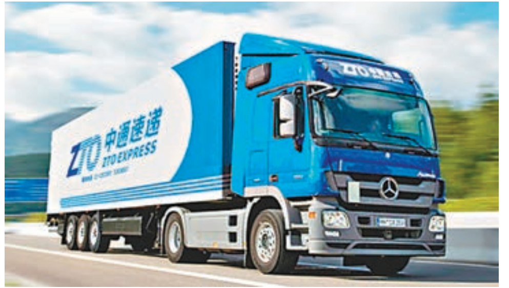
中通快遞擬赴美國上市，融資約95億元人民幣，將成為今年迄今最大規模的美國IPO，也如阿里巴巴，將以同股不同權形式上市。資料圖片

股東，亦將獲得更大空間和靈活度來退出投資。而在中國，上市之後一到三年內投資資金都會被鎖住。 另外，隨著對人民幣貶值憂心日益濃厚，在紐約IPO的話，中通快遞進行國際併購時就能以較穩定的美元計價股票進行交易。 阿里巴巴包裹量佔中通75% 阿里巴巴用中通快遞交貨，今年上半年阿里巴巴的包裹量就佔中通快遞75%。下月光棍節活動預計銷售會超越去年同期的紀錄高點143億美元。