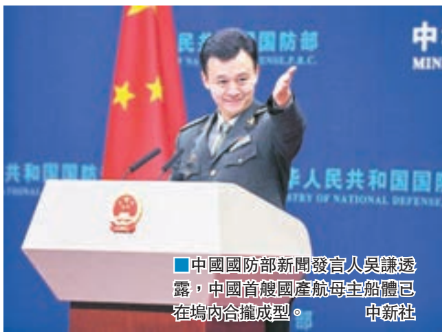
中國國防部新聞發言人吳謙透露,中國首艘國產航母主船體已在塢內合攏成型。