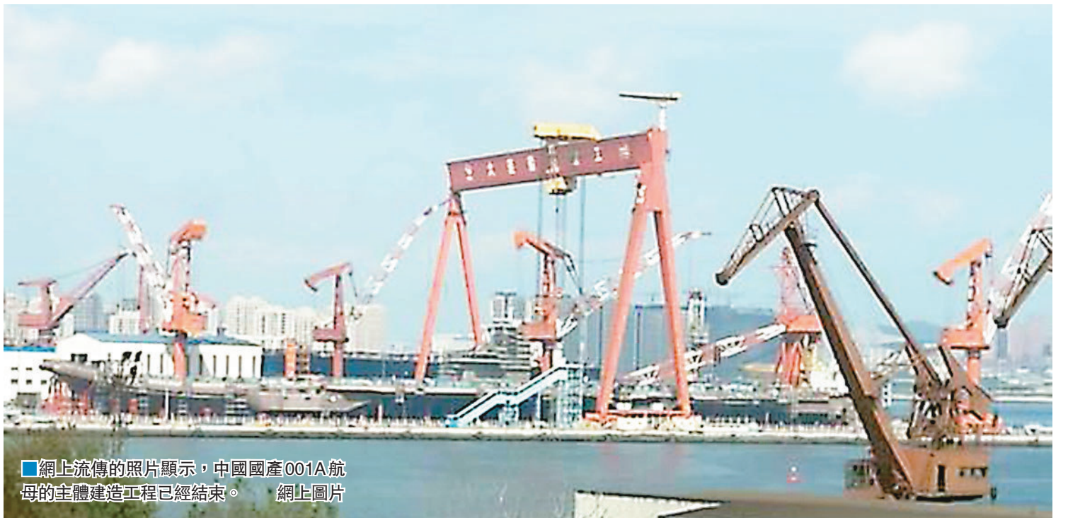
網上流傳的照片顯示,中國國產001A航母的主體建造工程已經結束。網上圖片

軍事專家李傑日前在接受人民網專訪時表示,中國發展航母是走循序漸進的道路,已經進入中大型航母國家序列,下一步,中國也會更多吸取像美國以及其他國家航母方面的先進經驗,在固定翼艦載機的性能以及無人平台的應用上會不斷提高,也會適當增加激光武器、新概念武器的應用,提高現有防空導彈、速射炮等武器的配套使用,將未來航母編隊打造得更強。