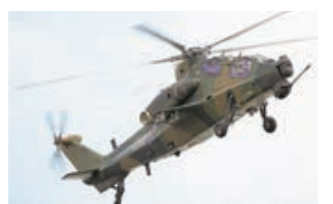
飛翔在珠海航展上空的直10武裝直升機。

香港文匯報訊(記者 劉凝哲 北京報道)今年是中國直升機工業創建60周年,中航工業將派出直升機領域最強陣容參加即將舉行的珠海航展。目前,直11WB輕型武裝直升機、直19E出口型武裝直升機、直9WE出口型武裝直升機、AV500輕型無人直升機、AV500W察打無人直升機等已陸續抵達珠海航展。此外,中方和空巴花費十餘年心血聯合研製的AC352直升機亦傳來好消息,這架世界先進的中型直升機將於2016年底首飛。