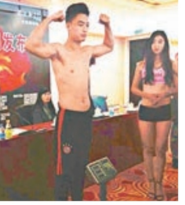
參賽選手上磅測量體重。

香港文匯報訊(特派記者王尚勇 寧夏報道)日前,記者從「河姆渡」盃WXF「盛武西夏」搏擊爭霸賽新聞發佈會上獲悉,寧夏首次搏擊爭霸賽將於29日在銀川市親水體育館開賽。寧夏綜合搏擊協會羅忠伙教練說,寧夏尚未舉辦過高水平的職業搏擊比賽,這與職業運動員和教練少,體育部門沒有專業的搏擊運動隊有關,導致這一運動項目社會影響力薄弱。