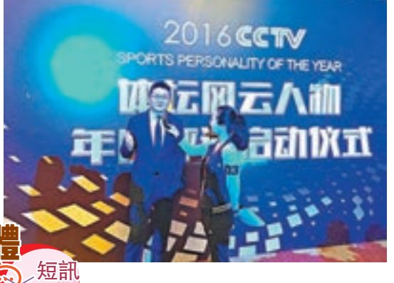
體壇風雲人物年度評選啓動儀式現場。

『小金人』的含金量,我們仍嚴格控制獎項數量。」據悉,本年度體壇風雲人物的初評工作將於11月24日至12月11日舉行,由400名專業評委進行記名投票,推選出各獎項的提名者,最終全部獎項的獲獎者將於明年1月中旬揭曉。 談及本屆體壇風雲人物評選工作,中央電視台體育頻道副總監方鋼表示,在本年度的CCTV體壇風雲人物當中,除將持續關注殘疾人體育精神外,還將目光聚焦在「大眾百姓」個體的身上,帶動大眾發現身邊的體育榜樣,推舉真正的運動達人,重新詮釋「體育的力量」這一主題。