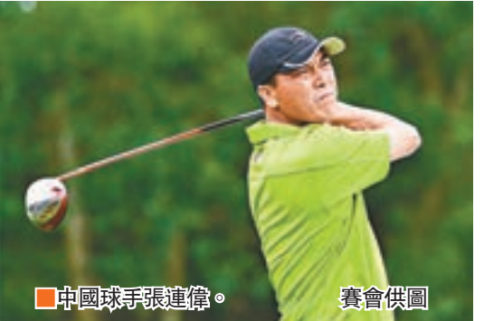
中國球手張連偉。

張連偉出戰清水灣高球賽 曾十四度出戰香港公開賽的中國名將張連偉,在收到平安銀行中國巡迴賽—美巡中國系列賽發出的邀請後,昨日確認出戰下周舉行的清水灣高爾夫球公開賽。總獎金高達120萬元人民幣的清水灣高爾夫球公開賽將於下月3至6日,假清水灣鄉村俱樂部進行。現年51歲的張連偉,很期待重返清水灣作賽;他說道:「我很感謝平安銀行邀請我參加清水灣公開賽,這是我繼兩年前再度出戰平安銀行中國巡迴賽—美巡中國系列賽。我也對重返清水灣甚感興趣,因為曾在那裡作賽數次,它的確是我到過風光最壯麗的球場之一。目前我狀態仍非常好,有時也能打出低標準桿,所以這是一次好機會讓我嘗試對抗這些來自全球的年輕、新晉球手。」 張連偉是首位三度於中國業餘公開賽封王的球手,他在職業生涯中記下了一連串光榮事蹟,包括在新加坡舉行的加德士大師賽的加洞賽擊敗了世界頂尖好手厄尼埃爾斯奪冠,成為首位贏得歐巡賽的中國人,並參加了2004年的大師巡迴賽。 記者 梁啓剛