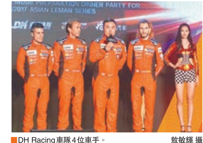
DH Racing車隊4位車手。