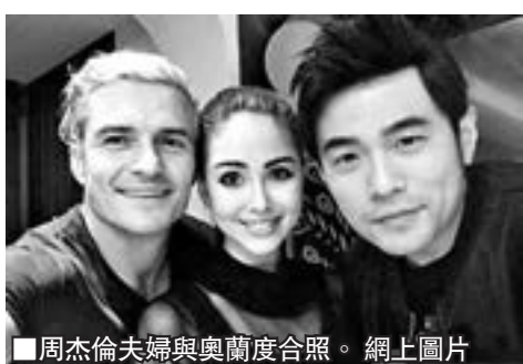
■周杰倫夫婦與奧蘭度合照。

樂的instagram留言「恭喜恭喜」。不過阿樂臨出場前，在後台不慎撞損鼻樑皮外傷「見紅」，他百無禁忌還風騷笑說：「開張見紅，生意興隆，鴻運當頭呀！」他更索性連膠布不用，帶着紅(鴻)運當頭滿場飛。