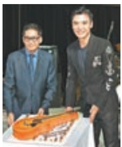
■鍾鎮濤奪得「CASH音樂成就大獎2016」。

香港文匯報訊(記者 李思穎)「CASH周年晚宴暨金帆音樂獎頒獎典禮」將於11月1日假會展舉行，昨日舉行發佈會公佈各獎項入圍名單，更率先揭曉由鍾鎮濤(阿B)奪得「CASH音樂成就大獎2016」，而其他到場歌手有穿上低胸開高叉騷腿裙的王灝兒(JW)、方皓文、衛蘭、王梓軒等。