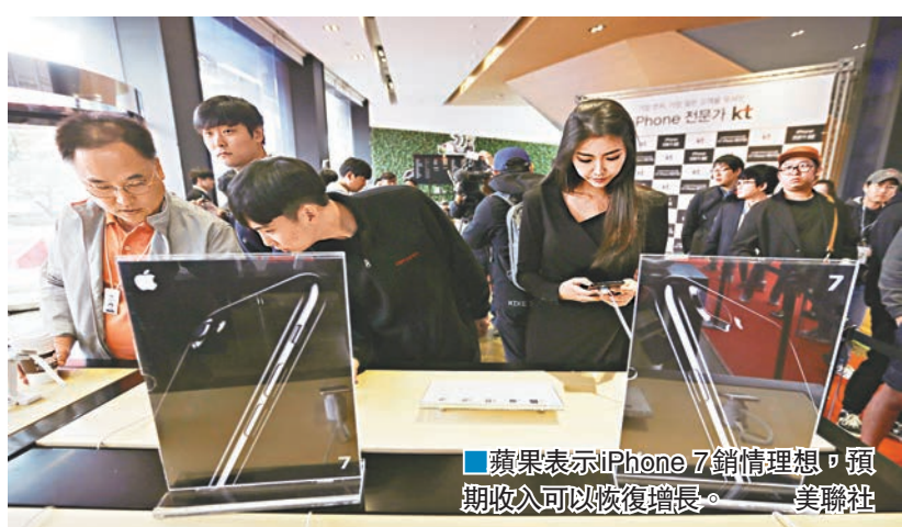
■蘋果表示iPhone 7銷情理想，預期收入可以恢復增長。