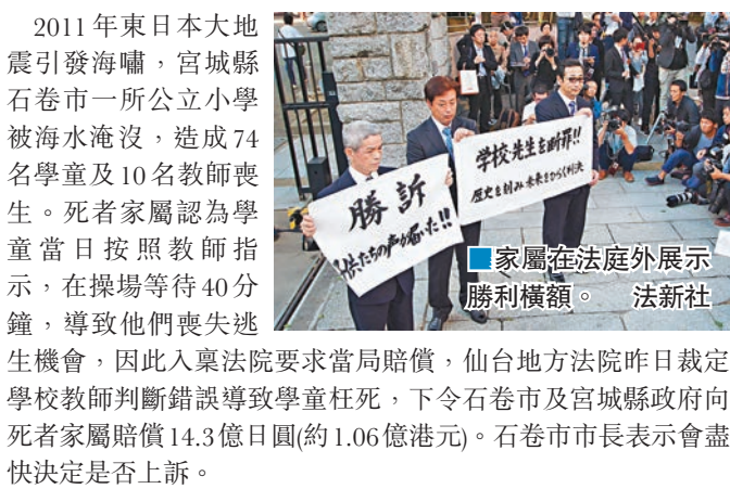
■家屬在法庭外展示勝利橫額。

2011年東日本大地震引發海嘯，宮城縣石卷市一所公立小學被海水淹沒，造成74名學童及10名教師喪生。死者家屬認為學童當日按照教師指示，在操場等待40分鐘，導致他們喪失逃生機會，因此入稟法院要求當局賠償，仙台地方法院昨日裁定學校教師判斷錯誤導致學童枉死，下令石卷市及宮城縣政府向死者家屬賠償14.3億日圓(約1.06億港元)。石卷市市長表示會盡快決定是否上訴。