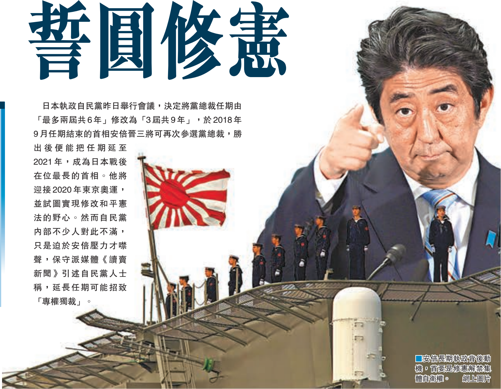
■安倍長期執政背後動機，首要還是修憲解禁集體自衛權。

日本執政自民黨昨日舉行會議，決定將黨總裁任期由「最多兩屆共6年」修改為「3屆共9年」，於2018年9月任期結束的首相安倍晉三將可再次參選黨總裁，勝出後便能把任期延至2021年，成為日本戰後在位最長的首相。他將迎接2020年東京奧運，並試圖實現修改和平憲法的野心。然而自民黨內部不少人對此不滿，只是迫於安倍壓力才噤聲，保守派媒體《讀賣新聞》引述自民黨人士稱，延長任期可能導致「專權獨裁」。