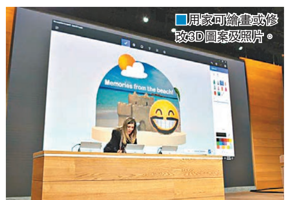
■創作者更新」專用軟件，售價由299美元(約2,319港元)起。

微軟公司昨日宣佈將於明年初，為視窗10作業系統提供免費的「創作者更新」。更新內容包括支持擴充及虛擬實境遊戲的功能，並讓用戶可以在手機掃描立體物件後製作3D圖像，更會推出全新的「小畫家3D」供編輯3D圖像。 根據微軟的展示片段，用戶可以透過「小畫家3D」，繪畫或修改3D圖案或照片。微軟視窗及裝置部執行副總裁表示，這次更新是專門為遊戲愛好者度身訂做，又透露公司會同時推出「創