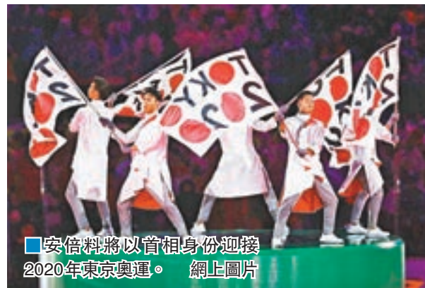
■安倍料將以首相身份迎接2020年東京奧運。