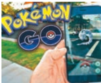
■Pokémon GO一度在全球掀起熱潮。網上圖片

雖然手機遊戲Pokémon GO一度在全球掀起熱潮，但並未為擁有《寵物小精靈》系列版權的任天堂帶來實質利益。任天堂昨日公佈全年業績預測，表示受家用遊戲機Wii U及手提遊戲機3DS等銷情不理想拖累，加上日圓持續強勢，決定向下修正全年盈利預測，由原先估計的450億日圓(約33.5億港元)降至300億日圓(約22.3億港元)，全年收入預測亦下調6%至4,700億日圓(約349.6億港元)。