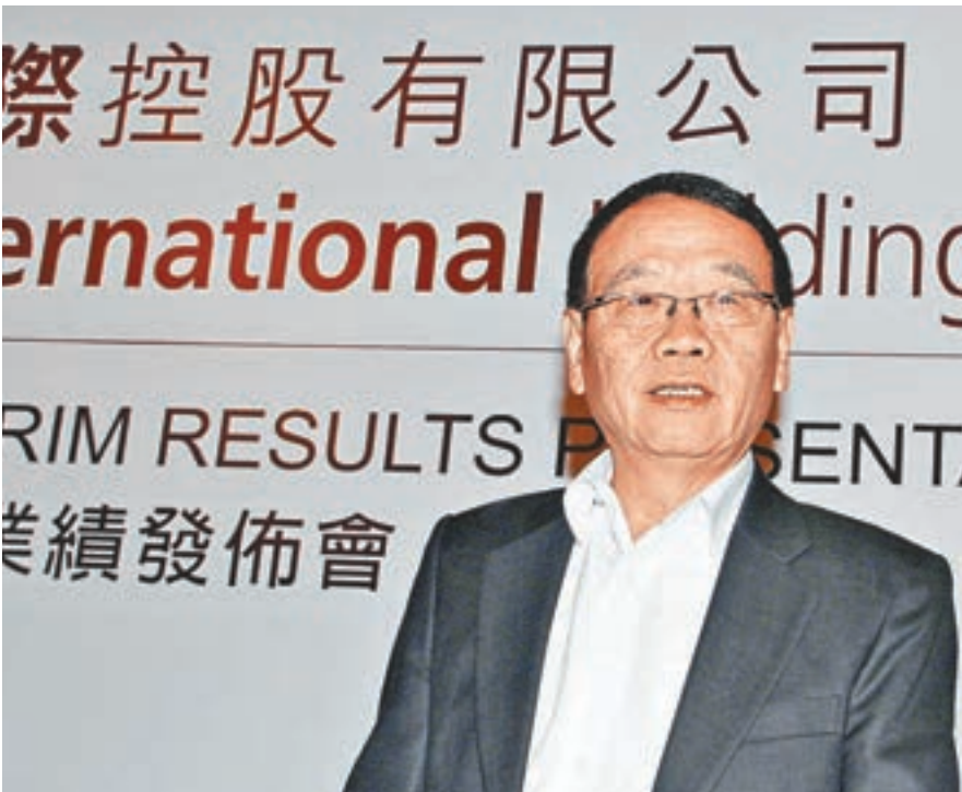
■盛百椒表示，近年內地線下銷售環境非常嚴峻，估計跌幅很難在短時間扭轉，可能維持最少2年。

預測，「現在公司做的幾件事，最後的結果，老實說，我失去明顯的判斷，雖然如此，該做的轉型還得做，如果不做，真正最嚴寒的冬天來的時候就是死亡了。」