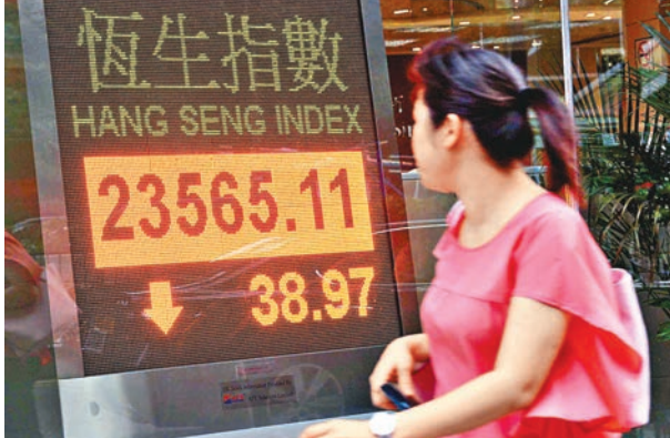
■港股昨日窄幅上落，全日波幅不足125點。

藍籌個別走向，其中百麗(1880)中期純利跌近兩成，又減派息，管理層聲明鞋業嚴冬未過，股價全日