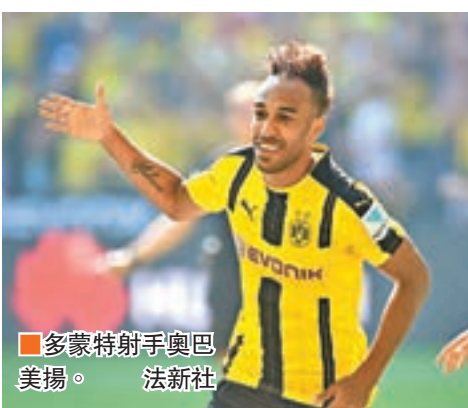
多蒙特射手奧巴美揚。法新社

至於另一支德甲豪門多蒙特明晨將主場對陣德乙球隊柏林聯。多蒙特近況麻麻，近5戰只得1勝3和1負，由於戰事頻密，球員已見疲態。柏林聯近期連友賽在內累積4連