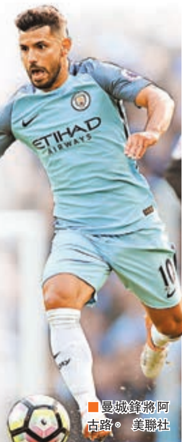
曼城鋒將阿古路。美聯社