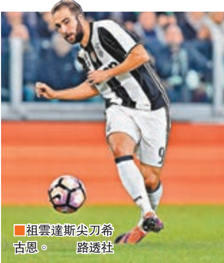
祖雲達斯尖刀希古恩。