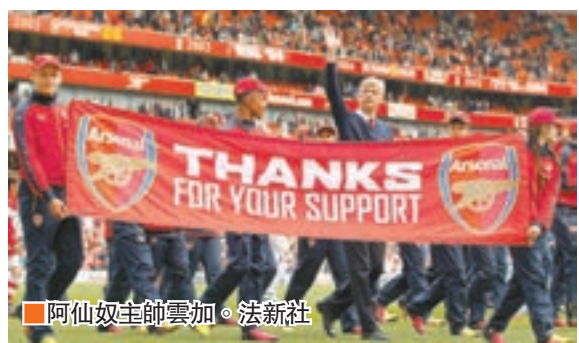
阿仙奴主帥雲加。