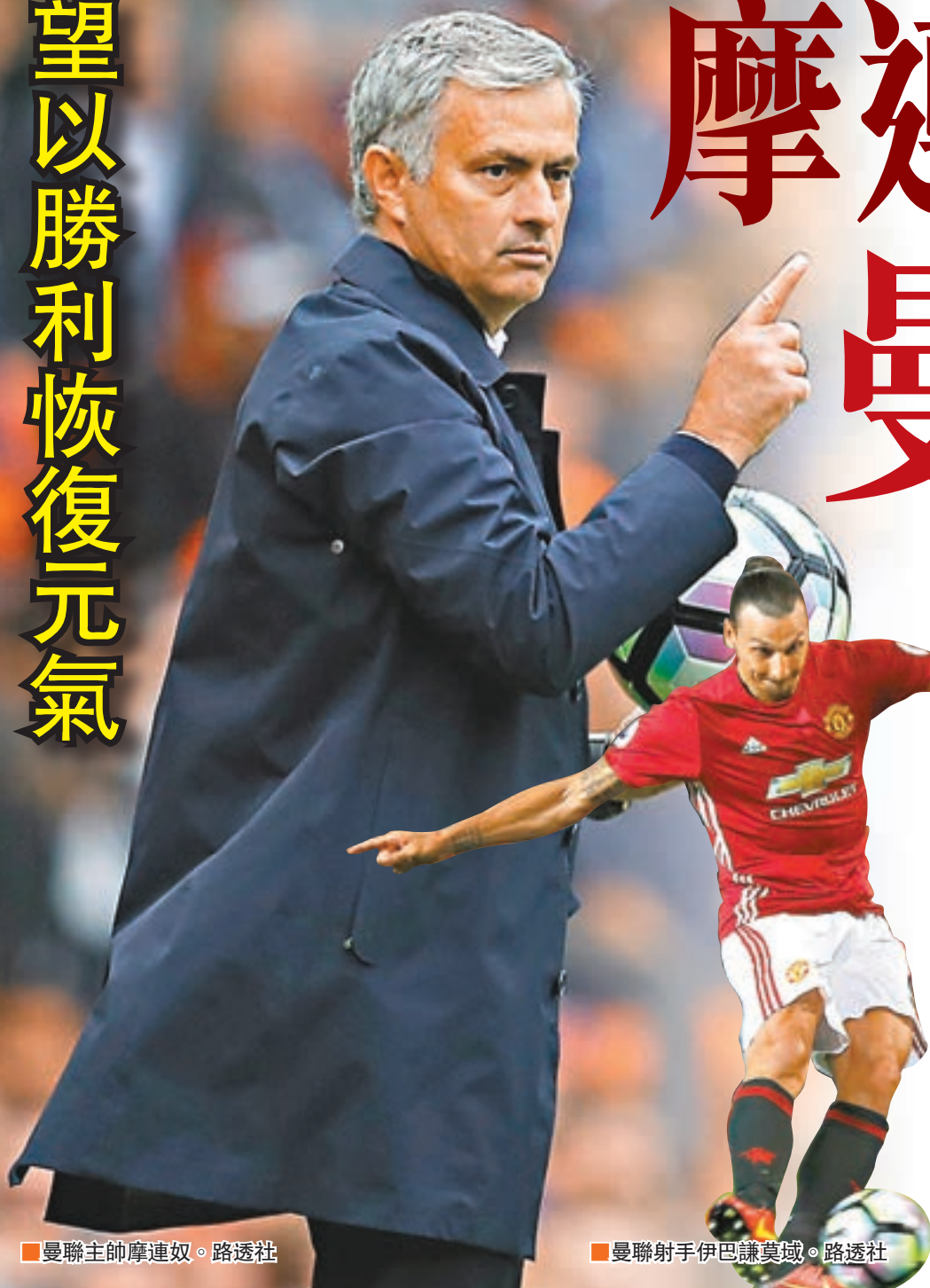
曼聯主帥摩連奴。

在英超客場0:4慘敗給車路士後，曼聯亟待通過一場勝利來恢復元氣，而他們明晨將在英格蘭聯賽盃主場迎來的對手是哥迪奧拿領銜的曼城；賽前，「魔君」摩連奴下了死命令，要求曼聯全隊三軍用命，一定要拿下這場「曼市打吡」。(本港時間周四3:00a.m.開賽)