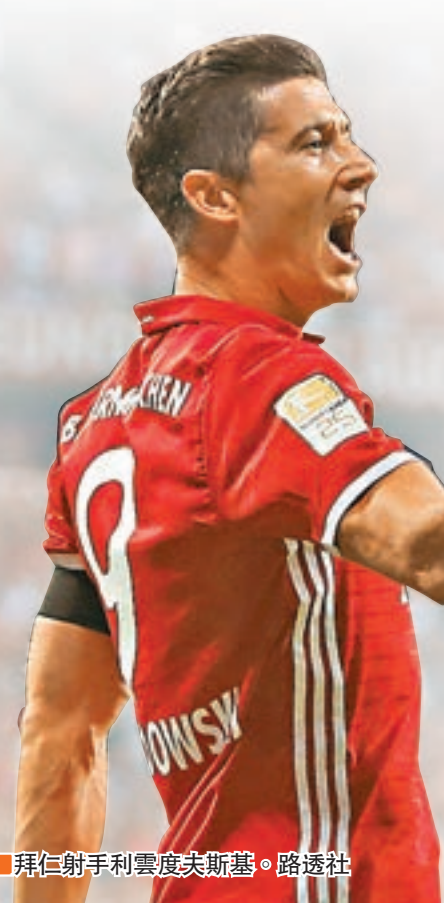
拜仁射手利雲度夫斯基。