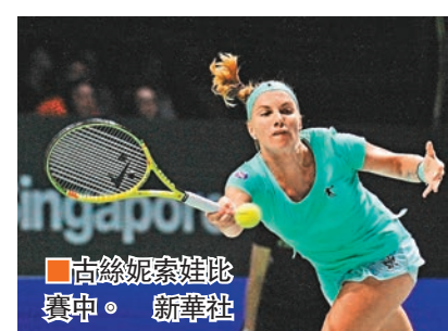
古絲妮索娃比賽中。