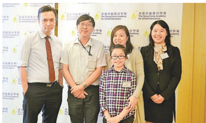
■校方指資優生通常自我要求極高,不易快樂,故會加強情意教育,改善學生的心理素質。

香港文匯報訊(記者 吳希雯)一般人認為天資聰穎的小孩,在成長路上肯定會一帆風順,但事實卻不然。專門培育資優生的香港資優教育學苑委託香港中文大學進行調查,了解學苑學員及校友的個人成長情況,結果發現,近6%於文憑試有5科5**或以上,逾三成入曾上過學院院長榮譽榜(Dean's List)或一級榮譽畢業,但約兩成至四成資優生卻指自己無值得自豪的成就。校方分析指,這類學生自我要求極高,不易快樂,故會加強情意教育,改善學生的心理素質。